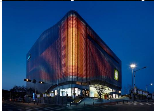
Рис. 2. Galleria Centercity – медиа-фасад с эффектом оптической иллюзии. Архитектор Бен ван Беркель компании UNStudio. Реализация – Южная Корея, 2011 год. Оптический эффект фасада заключается в образовании объемных муаровых узоров. В ночное время здание оживает мириадами огней и красок благодаря сложной системе подсветки и генерируемой компьютером анимации, отображающейся на фасаде