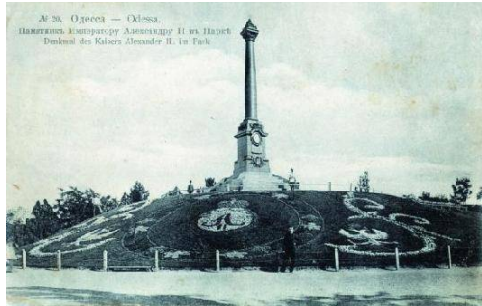
Рис. 1. Александровская колонна, 1891 г.

«С 30-х гг. XIX в. элементом, определяющим пропорциональный строй, композицию и облик фасада, становится декор, обрамляющий окна и простенки между окнами» [1, с. 96].