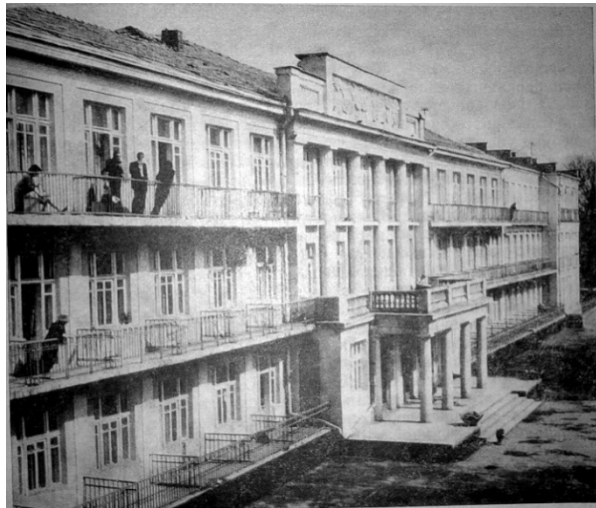
Рис. 22. Спальный корпус санатория «Россия», 1935–1939 гг., арх. М. А. Кац, М. А. Шлифер

Применение ордерных форм на различных этапах развития архитектуры Одессы способствовало формированию единого архитектурного пространства, преемственности архитектурных традиций.