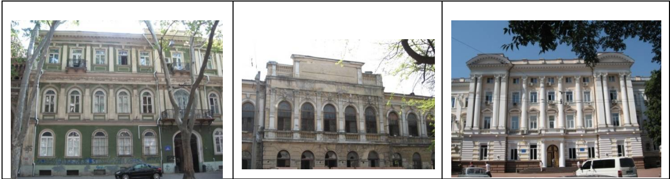
Рис. 10. Дом Вучини, 1849 г., арх.Ф. О. Моранди

Оконные и дверные проёмы оформлялись комплексами форм как с линейно-плоскостным, так и с объёмно-пространственным расположением ордера. Ордер в виде пилястр или полуколонн располагался между оконными проёмами, поддерживал арку проёма, разделял оконные проёмы, в виде герм – кариатид и атлантов вводился в композицию фасада (рис.17, 18, 20, 21).