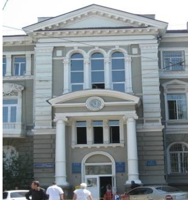
Рис. 7. Здание земской управы, 1890-е гг., арх. Н. К. Толвинский