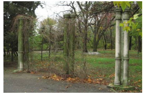
Рис. 3. Колонны на даче Ашкенази, 1901 г., Французский бульвар, 85