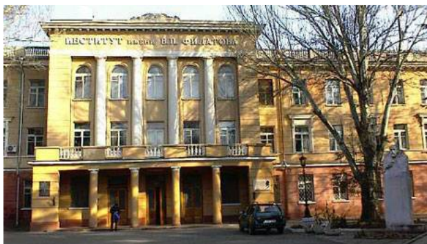
Рис. 24. Институт глазных болезней и тканевой терапии им. Филатова, 1939 г., арх. М. А. Кац, Л. Л. Кордовский, М. А. Шлифер