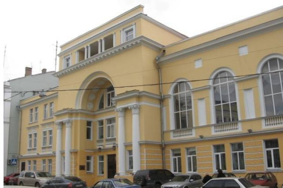
Рис. 26. Музыкальная школа им. П. С. Столярского, 1938–1939 гг., коллектив архитекторов под руководством Ф. А. ТROUPЯНСКОГО