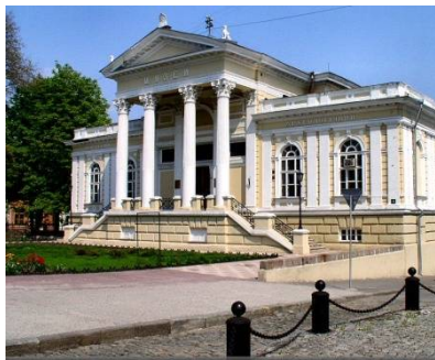
Рис. 4. Археологический музей, 1883 г., арх. Ф. В. Гонсиоровский