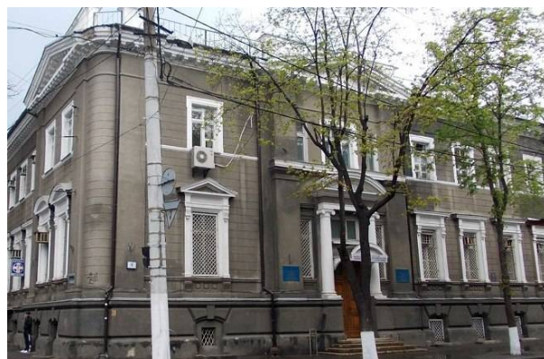
Рис. 25. Институт курортологии, 1936 г., арх. Ф. А. ТROUPЯНСКИЙ