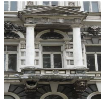
Рис. 9. доходный дом Лерхе, 1895 г., арх. Г. К. Шевребрандт