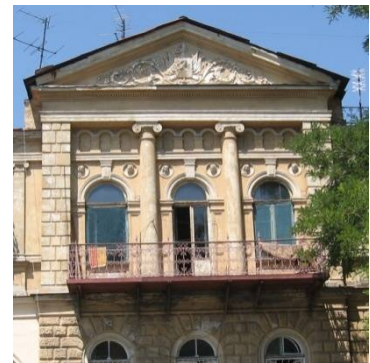
Рис. 6. Дом Зака, 1870-е гг., арх. Ф. В. Гонсиоровский