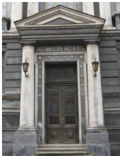
Рис. 5. Анатомический институт Новороссийского университета, 1895 г, арх. Н. К. Толвинский