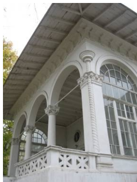
Рис. 8. Дача Ашкенази, 1901 г., арх. В. И. Прохаска