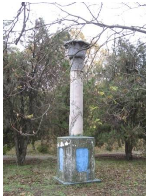
Рис. 2. Колонна на даче Новикова, Французский бульвар, 71