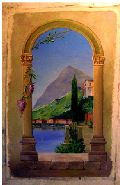
Фреска, выполненная в мастерской Автор Белая Д.Ю.

Некоторые из росписей выполнены мною в мастерской на холсте. Впоследствии их монтируют на объекте (рис. 2). Холст грунтуют акриловым грунтом, поверх наносится фактурная шпаклевка.