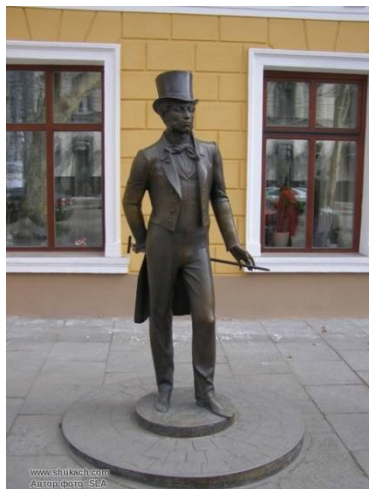
Рис.6 Памятник А.С. Пушкину