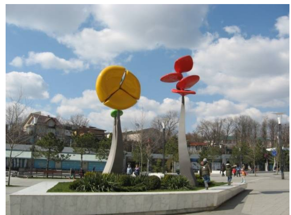
Рис.13 Поворачивающиеся «Цветы»

Выводы. В Одессе современная скульптура (чаще всего) включается в городской ландшафт посредством её расположения в зоне пешеходного движения и тактильной доступности для зрителя. Для выделения монументов в сложившейся градостроительной