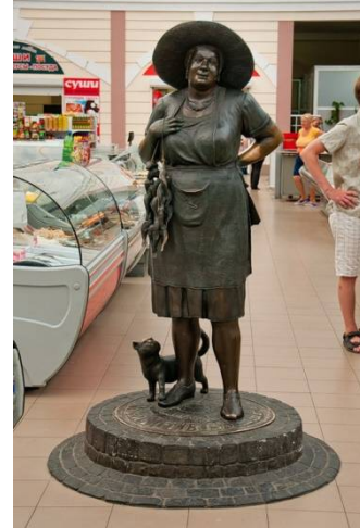
Рис.9 «Тётя Соня»