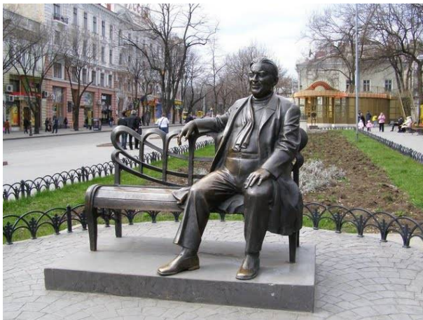
Рис. 10 Памятник Леониду Утёсову