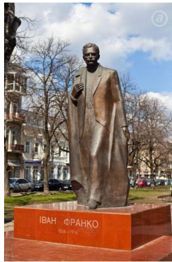
Рис.2 Памятник Ивану Франко