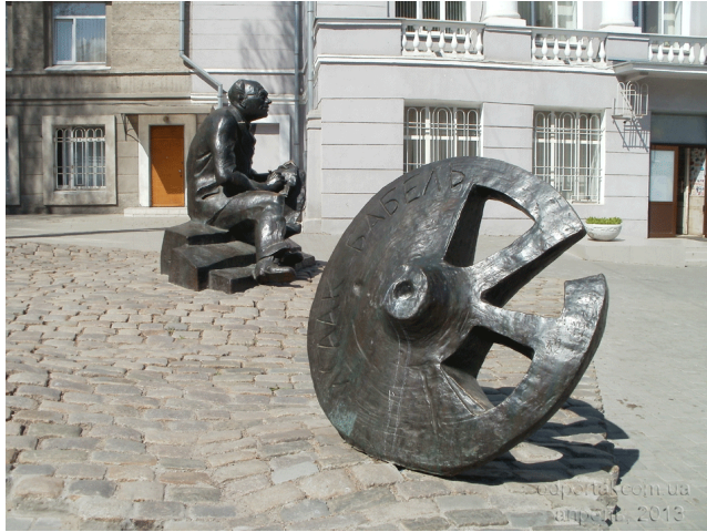
Рис.8 Памятнику Исааку Бабелю