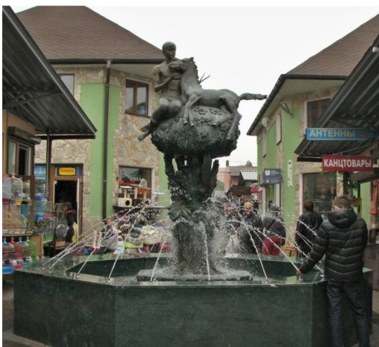
Рис.12 Фонтан «Добру и совершенству»