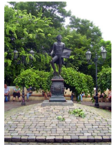
Рис.3 Памятник Де Рибасу