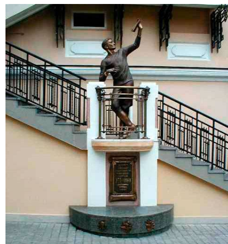
Рис.7 Памятник С. Уточкину