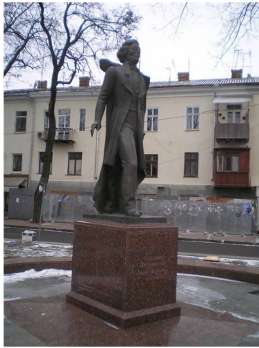
Рис.1 Памятник Адаму Мицкевичу