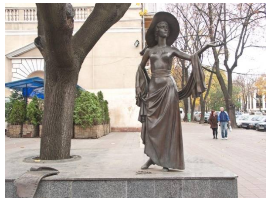
Рис.5 Памятник Вере Холодной