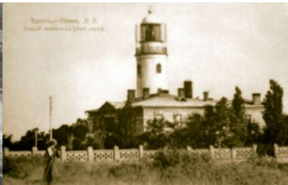
Рис. 4. Вид на маяк

Исторической жемчужиной этого района является Свято-Успенский Одесский патриарший монастырь – православный мужской монастырь в честь Успения Пресвятой Богородицы (рис.3). История возникновения Свято-Успенского Одесского мужского монастыря связана с именем митрополита Гавриила. С разрешения Святейшего Синода в 1814 году митрополит Гавриил основал на пожертвованной земле архиерейское подворье, где за два года была построена деревянная церковь в честь Успения Божией Матери. В то же время началось и сооружение маяка, но ввиду значительных расходов окончание его строительства было передано гражданскому морскому ведомству (впоследствии маяк был перенесен на другое место) (рис. 4). 1 июня 1824 года Святейшим Синодом было принято постановление о преобразовании архиерейского подворья на Большом Фонтане в Одессе в Успенский мужской монастырь. В 1825 году состоялось освящение каменного собора, который воздвигнут на месте прежней деревянной церкви. К этому времени, кроме Успенского собора, уже были построены двухэтажный архиерейский дом, трапезная, кухня, гостиница для приезжих, устроены колодцы, насажены виноградники, построена каменная ограда. После 1834 года монастырская братия на свои средства построила еще одну небольшую церковь в честь святителя Николая Чудотворца. Приблизительно в 1920 году с восточной стороны Свято-Никольской церкви был пристроен братский корпус, который и ныне находится под одной с ней крышей [6].