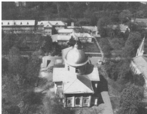
Рис. 3. Вид на патриарший монастырь

Пляжи Большого Фонтана за 16-й станцией переходят в пляжи Люстдорфа. В народе эта местность также известна как 411 батарея (в честь одноименного мемориального комплекса-парка неподалеку). Это излюбленное место для маевок и просто отдыха одесситов. В переводе с немецкого Люстдорф – «Веселое село», удален на 15 км от центра Одессы. В настоящее время представляет собой район с развитой инфраструктурой и дачами одесситов [5].