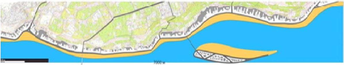
Рис. 6. Проект А. Бабчинского по развитию пляжей

3. Возможная интеграция пляжа и набережной парадной застройки в случае продолжения пляжа песка. Город приобретает от "Панкратов" до "Архиди" 84 га ширины пляжа, 150 га ширины до точки "Золотой берег".