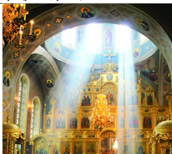
Рис. 2. Верхнє та бокове освітлення Володимирського собору.

Біля вікон відображаються образи Ангельських Сил, які повідомляють нам про світ Божих осянянь. В олтарі де знаходиться престол Божий, у східній частині проектується три вікна, що знаменують Боже Світло, а проникаюче в ранкові