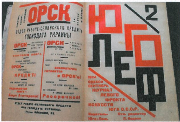
Рис. 3. Обложка журнала «Юголеф» № 2, 1924.