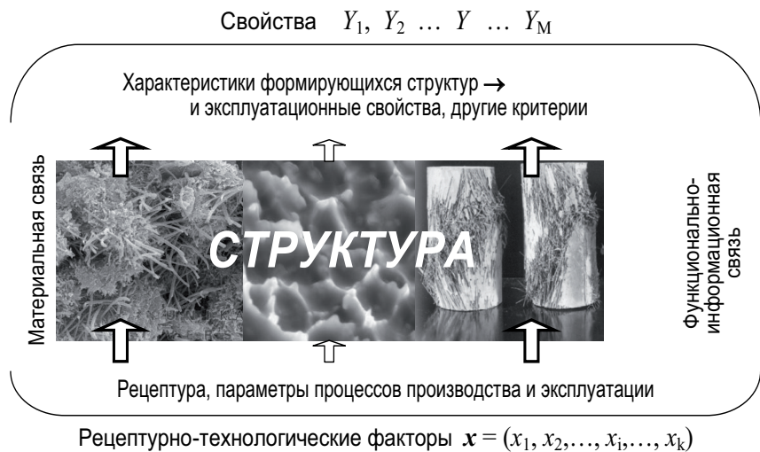
Рис. 1. Схематическое изображение связей при рассмотрении цепи «рецептура, технология → структура → свойства».

Схема на рис. 1 подчеркивает природу случайных величин Y , характеризующих реакцию структуры материала на управляемые воздействия x и в силу этого представляющих информационную базу для формирования желаемых структур за счет тех или иных значений РТ-факторов.