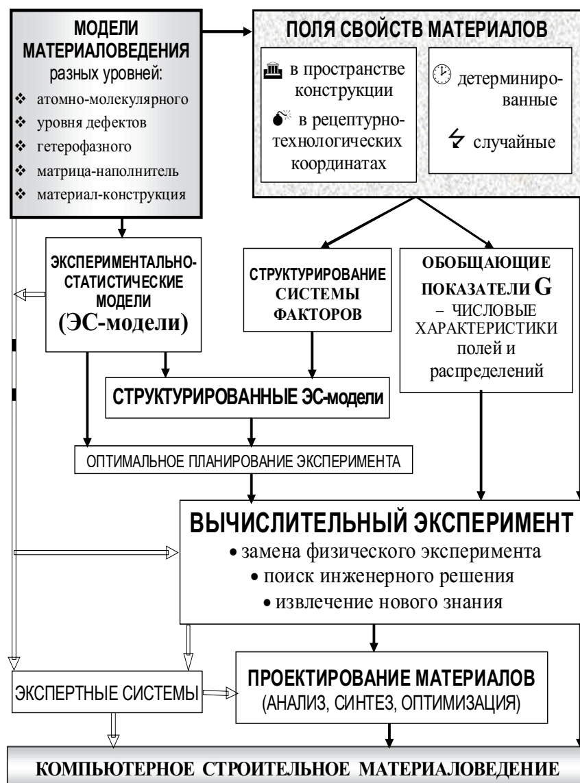
Рис. 3. Схема включения концепции полей свойств и ЭС-моделей в компьютерное строительное материаловедение.