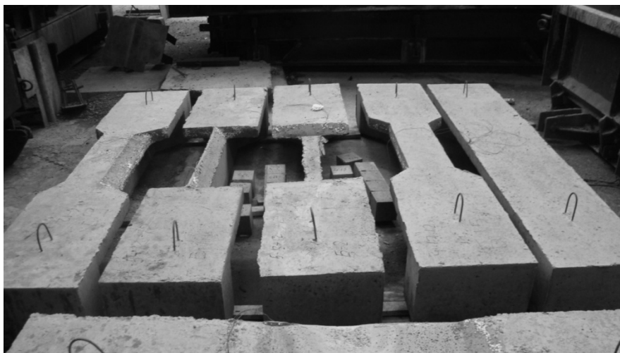
Рис.1. Образцы поврежденных балок для испытаний

В рамках планируемого эксперимента принята трехфакторная модель с факторами варьирования: