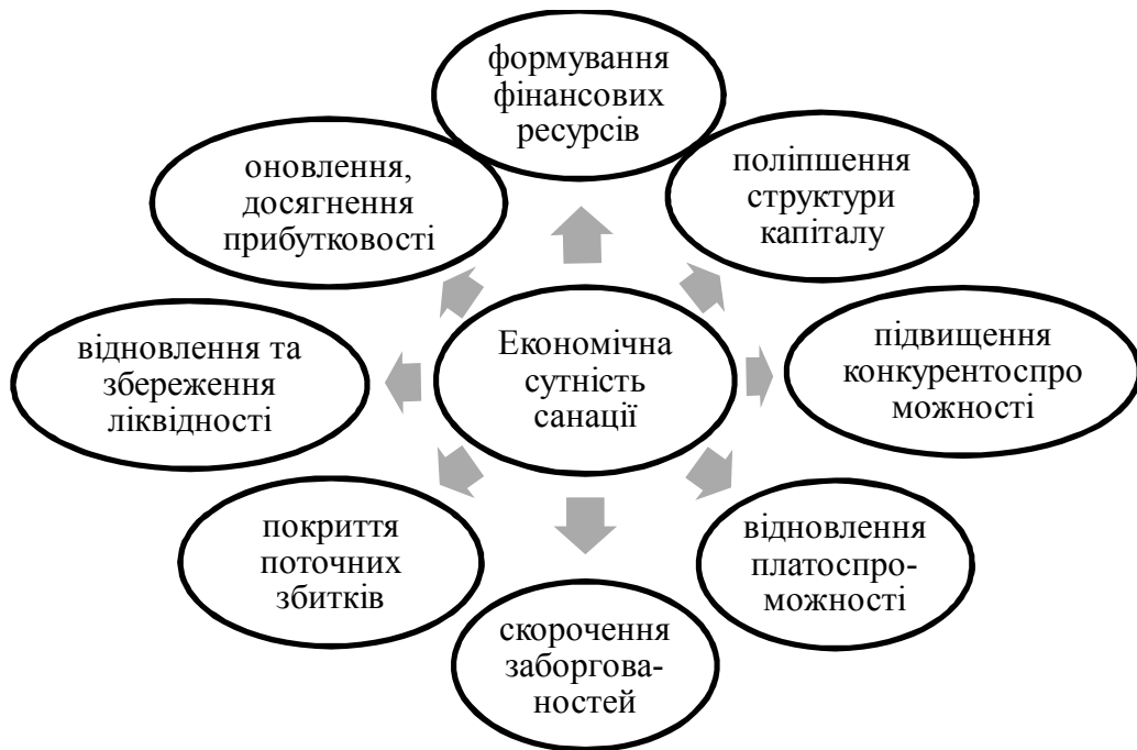
Рис.2. Економічна сутність санації на підприємстві

Економічне поняття санації представлено на рис.2.