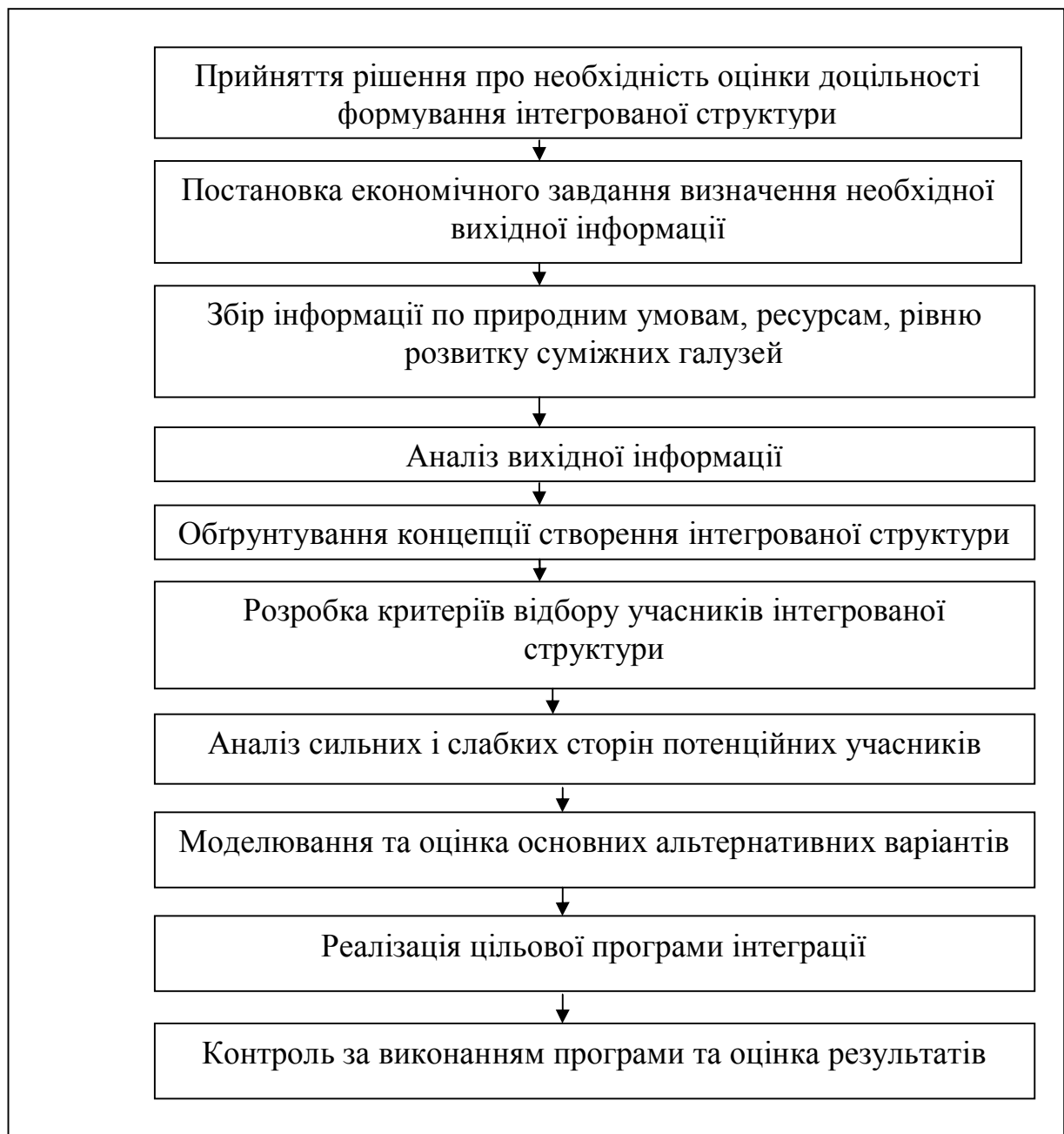
Рис. 1. Алгоритм створення будівельної інтегрованої структури