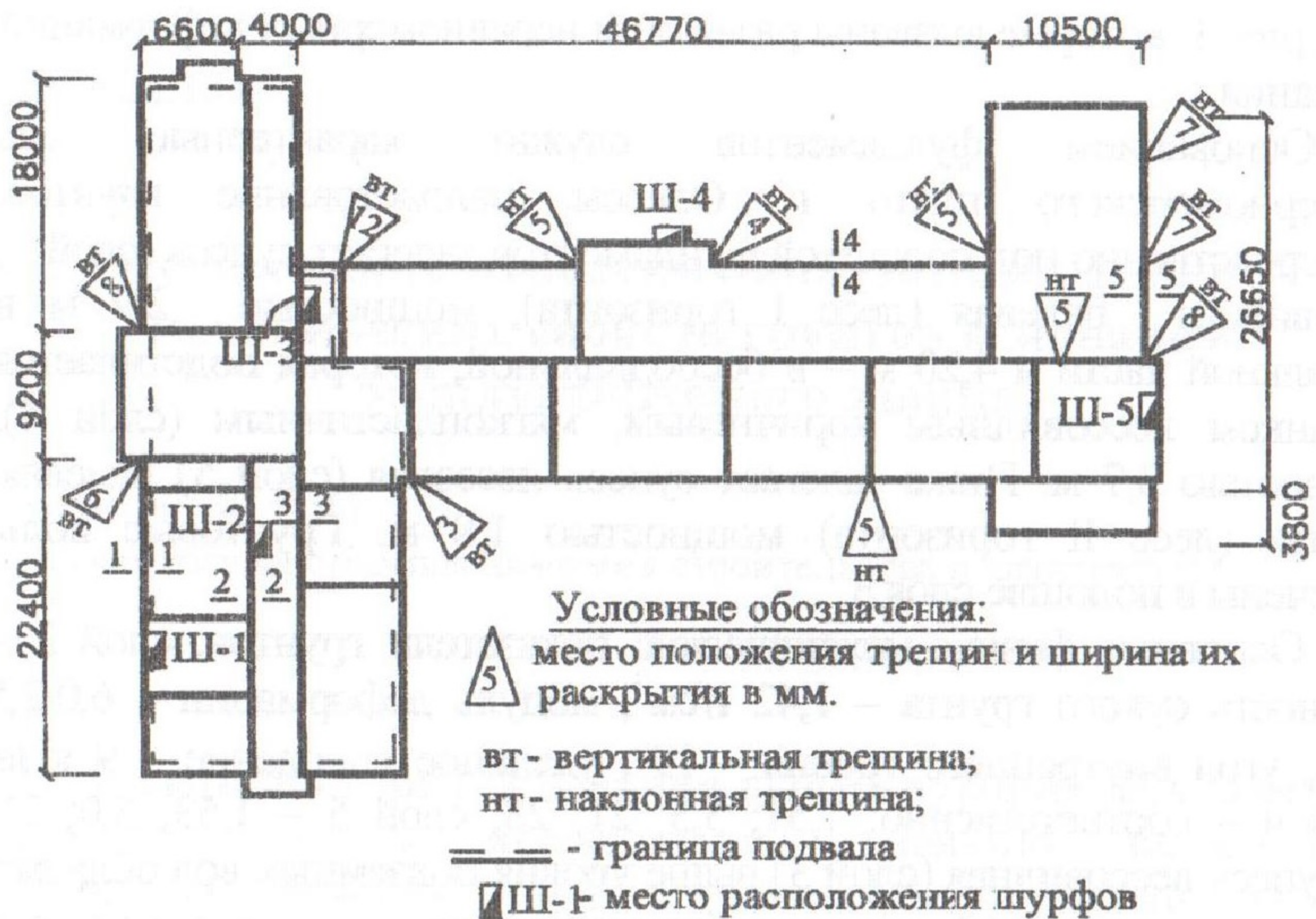
Рис.1 Схема развития деформаций в несущих стенах