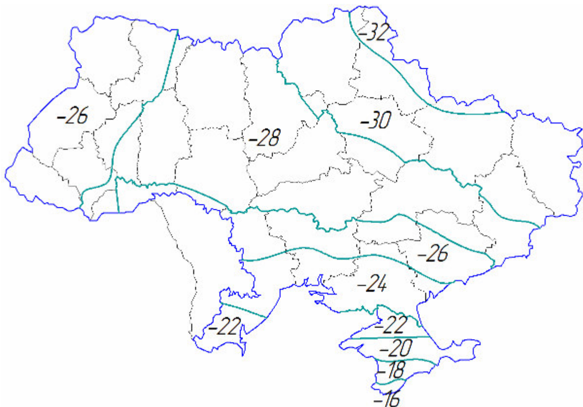
Рисунок 1 – Територіальне районування України за характеристичним значенням температури найхолоднішої доби t_{c0}

З наведених нижче карт (рис.1, 2, 3) видно, що прийняті параметри забезпечили отримання досить плавних і систематично розміщених меж територіальних районів (ізотерм). У деяких випадках межі територіальних районів суміщені з межами адміністративних областей, поблизу яких вони проходили, що забезпечує однозначність рішення щодо віднесення певних населених пунктів чи територій до тих або інших районів.