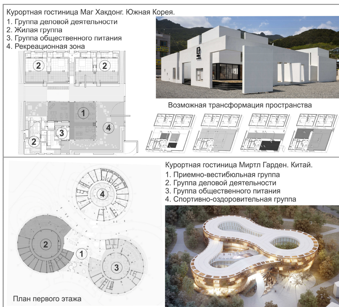
Рисунок 2 – Примеры курортных гостиниц с деловой специализацией

При расчете количества машиномест на стоянке курортной гостиницы необходимо учитывать ее возможное использование участниками деловых встреч, которые не планируют вселяться в гостиницу и пользуются лишь услугами группы деловой деятельности и, возможно, группы общественного питания.