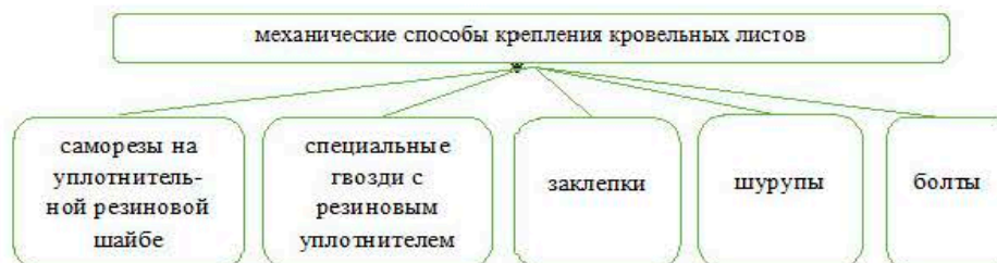
Рис. 2. Классификация механического способа крепления кровельных листов

Первый способ механический. Механическим способом крепить довольно легко и быстро. При этом способе увеличивается расход материала за счет обязательного нахлеста соседних листов. К тому же в отверстия, сделанные в самом материале, может просачиваться вода. Со временем материал корродирует и требуется частичная или полная замена покрытия. На рис. 2 представлена классификация крепления кровельных листов механическим способом.