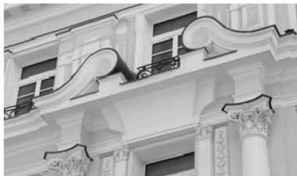
Рис. 1. Защита элементов фасада

дняшний день успешно покрывают высококачественными полимерными красками и т.д. Все эти материалы объединяет одно – момент крепления к фасадным элементам, что иногда создает определенные трудности из-за невозможности крепления обычным механическим способом.