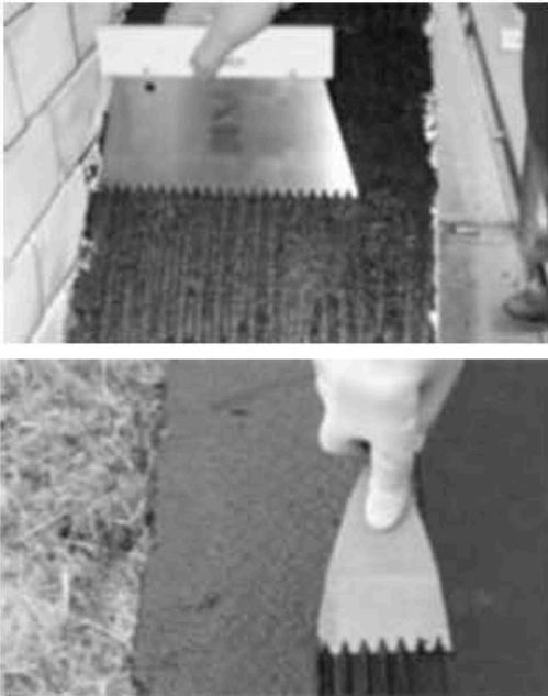
Рис. 5. Процесс нанесения клеевого состава на поверхность

2. Долговечность крепления, коррозионная стойкость. В отличие от механического способа (с точечным креплением в определенных местах) крепление с помощью клея осуществляется по всей поверхности приклеиваемого элемента фасада (рис. 5). Минимизируется коррозия самого кровельного изделия за счет исключения разрушающего действия конденсата между кровельным материалом и элементами фасада (исключение коррозии элементов крепления).