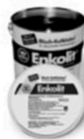
Рис. 4. Клей Энколит

Область применения клея широка. Энколит используется для облицовки металлических крыш или фасадов, а также при выполнении других работ из жести. Однако чаще всего к его помощи прибегают для приклеивания небольших деталей, таких, например, как подоконники и парапеты.