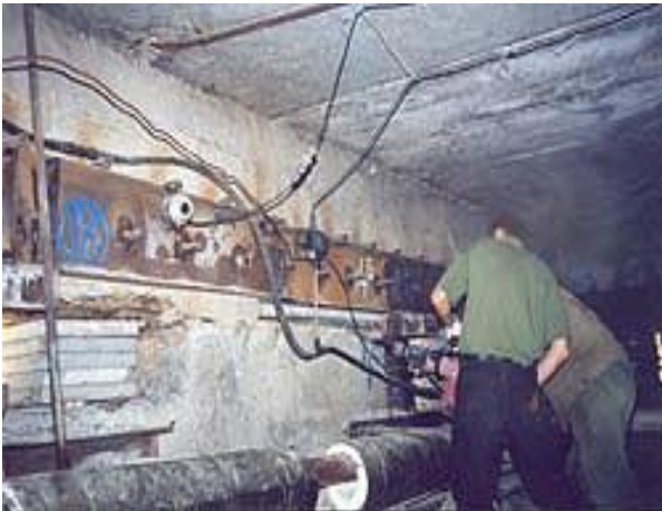
а) выпиливание ниши под установку домкратов