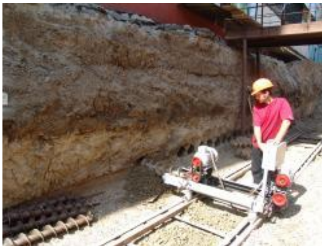
Рис. 5. Горизонтальное бурение под накренившимся зданием

Бурение горизонтальных скважин производится таким образом: сначала выбуриваются нечетные скважины по ряду (1, 3, 5), а за тем четные (2, 4, 6) и т.д. в зависимости от количества буровых установок; На рис. 5 показан процесс бурения горизонтальных скважин под аварийным домом.