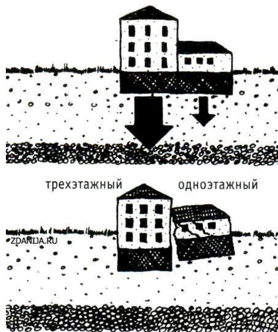
Рис.2. Просадка здания