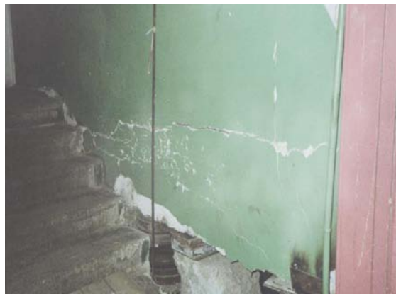
в) процесс подъема аварийной секции здания