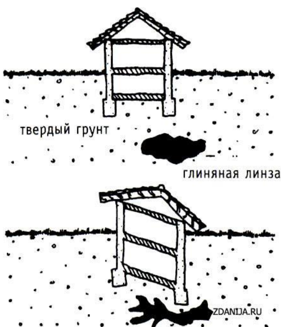
Рис. 1. Осадка дома