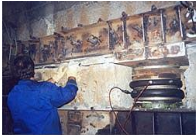
б) установка и наладка оборудования (домкраты)