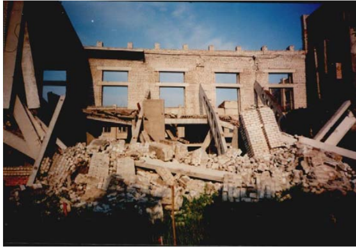
а) Обрушение аэроклуба г. Запорожье