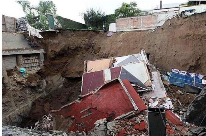
Рис. 3. Провал и обрушение дома

Процесс подъема здания, с помощью домкратов разработан НИИСКом применяется редко. Основными операциями, его являются следующие процессы: разборка асфальтового покрытия (при необходимости); устройство ниш для домкратов; установка домкратов в ниши; разрезка здания по периметру для отрыва его от фундаментов; подъем домкратами надземной части здания для выравнивания фундаментов; усиление и выравнивание верха фундаментов; замоноличивание по периметру здания; демонтаж системы домкратов; обратная засыпка; окончательная планировка и отделка основания или покрытия; проверка профиля дороги по шаблону.