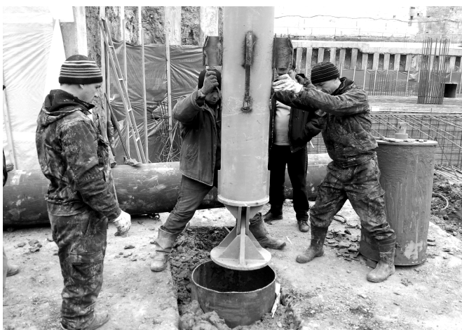
Рис. 1. Опускание штампа и колонны труб в скважину на площадке №1

При опускании штампа в забой скважины его проворачивали вокруг вертикальной оси по часовой стрелке и в обратном направлении для создания более плотного контакта с грунтом. В перекристаллизованном известняке перед установкой штампа в забой скважины подавали быстротвердеющий раствор из условия создания слоя толщиной 0,5-1,0\text{см} .