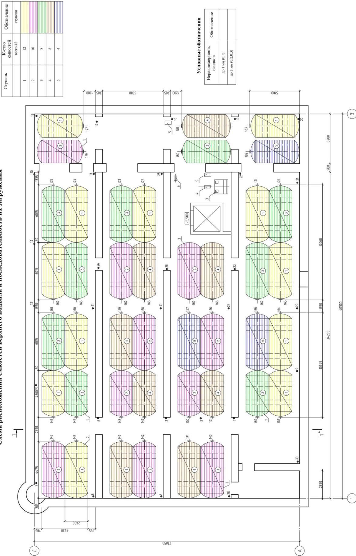
Схема расположения емкостей верхнего подвала и последовательность их загрузки