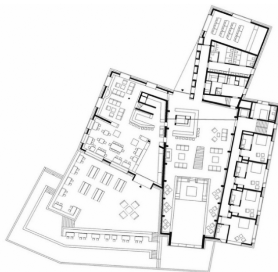
Рис. 5. Шетзерон готель. Загальний вигляд та планувальна схема будівлі.