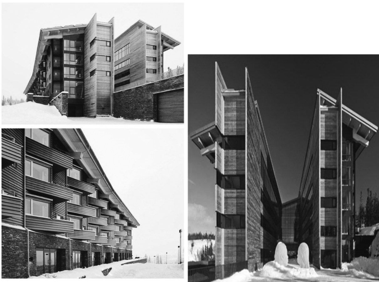
Рис. 2. Копперхілл Моунтайн лодж.

верхньому і нижньому поверсі. (Рис. 3, 4) Ця система безперервної смуги забезпечує оптимальні шляхи з точки зору прохідності і доступу до будь-якої точки готелю. Ухил доступу до маршрутів змінюється відносно один одного завдяки перепадам природнього рельєфу, а також зменшенням відстані між вертикальним напрямком.