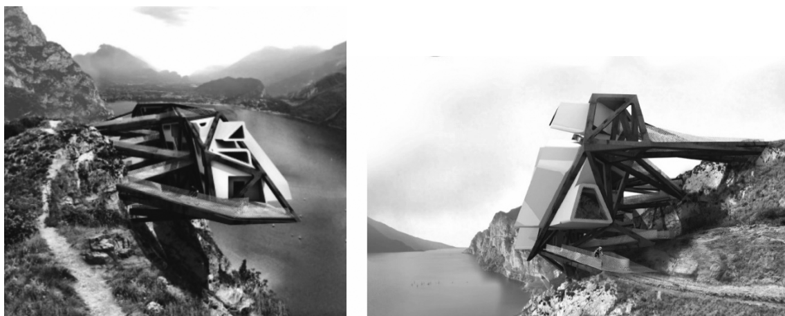
Рис.3. Ховаючись в Трикутнику. Загальний вигляд. Концепція