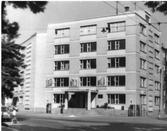
Рисунок 3 – Административное здание по ул. Артиллерийской, 1 в г. Одессе.

Структурная прочность лесса ниже подошвы подушки на участке испытаний – 70...75 кПа. От напряжений по подошве песчаной подушки, превышающих структурную прочность (начальное просадочное давление), развиваются деформации в подстилающем лессе. При меньших напряжениях деформаций ниже подошвы подушки не зафиксировано [2].