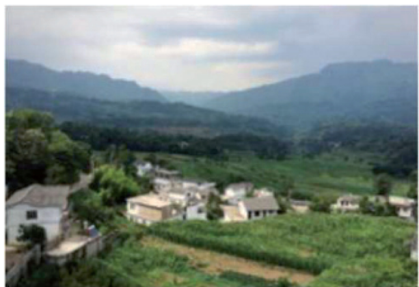
Рис. 3, 4. Схема школьного комплекса и пятна для застройки. Ландшафт