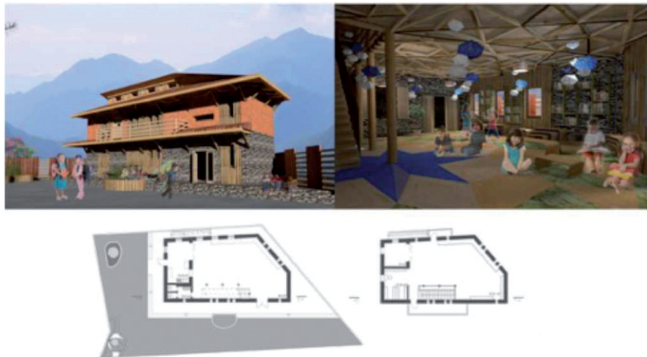
Рис. 5, 6. Концепция культурно-общественного центра школьного комплекса Liang Meing