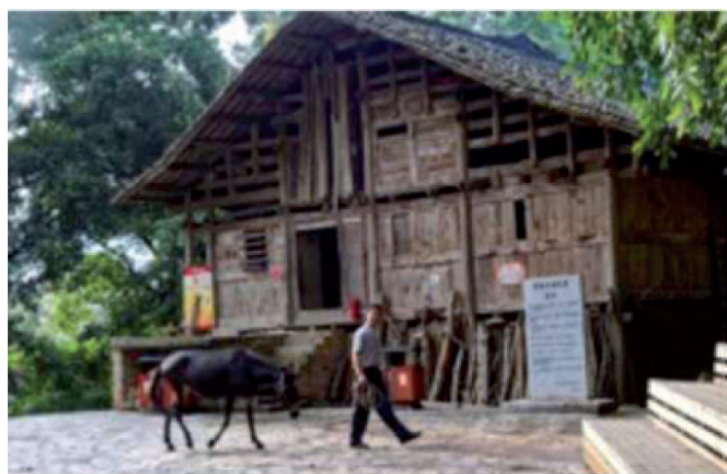
Рис. 1, 2. Местные жители. Традиционные материалы для строительства