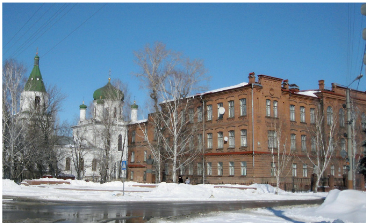
Рис. 3. Перекресток улиц Ленина и Дарвина, центральная часть города, фото март 2013 г., Церковь Воскресения Христа издание бывшего реального училища (ныне гимназия № 1).