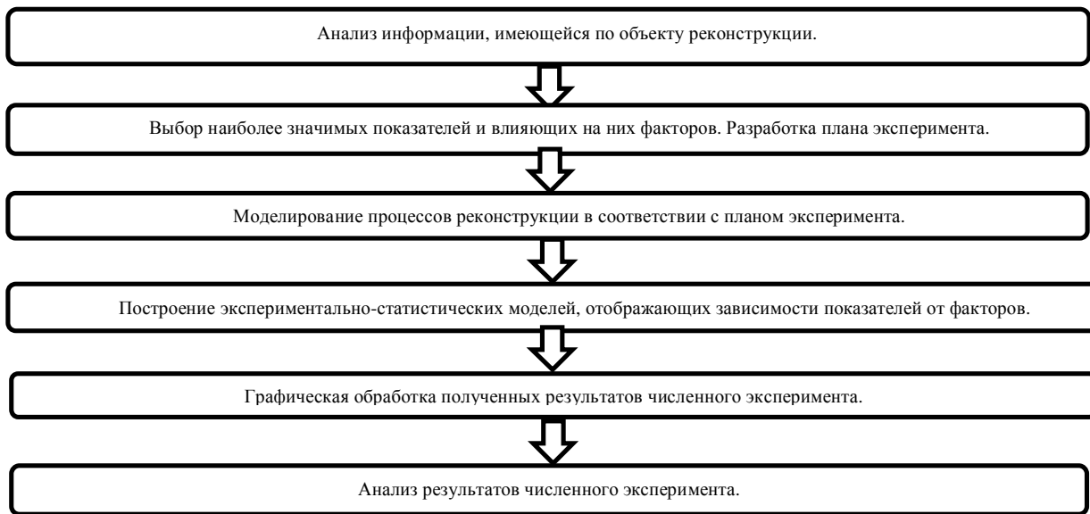
Рис. 1. Блок-схема методики исследования

Таким образом, настоящее исследование даёт количественную оценку альтернатив реализации проекта при изменяющихся вариантах организации комплекса восстановительных работ, условий финансирования и имеющихся ограничений.