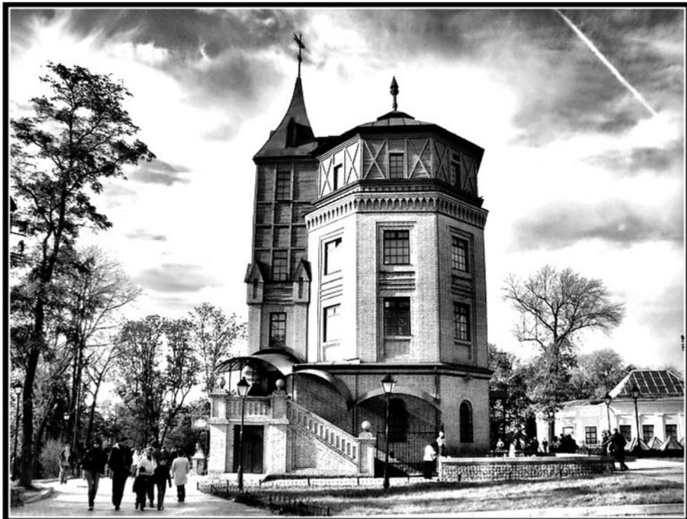
Рис. 3. Музей воды, Киев, Украина

Практика показывает, что самые популярные среди туристов те музеи, в которых можно не только посмотреть, но и потрогать и даже... попробовать экспонаты. Потому музеи напитков и продуктов питания можно встретить очень часто. Как правило, такие музеи открываются в подвалах пивоваренных заводов, при предприятиях пищевой промышленности и помогают продвижению продукции.