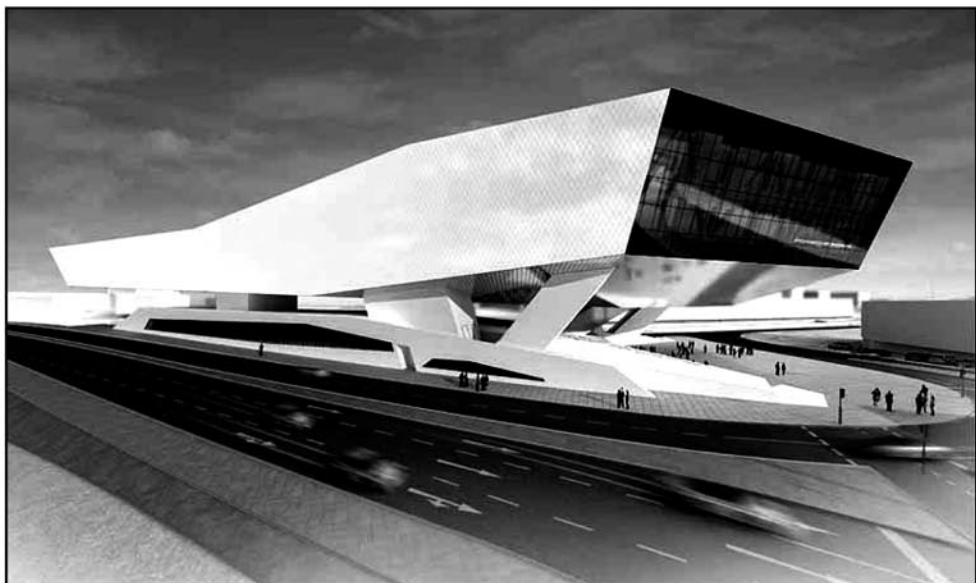
Рис. 2. Музей Порше (Porsche Museum), Штутгарт, Германия

сдержанной функциональности. В центре внимания — автошедевры и сопроводительные комментарии к ним. Интерьер выдержан в лаконичном, сдержанном стиле.