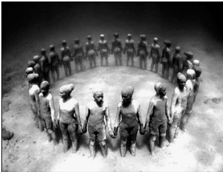
Рис. 1. Подводный музей скульптур, дно Карибского моря, Мексика. Скульптор: Джеймс Тейлор

Тематический музей — это возможность сделать населенный пункт местом паломничества туристов. Так, например, в России стал центром культурного туризма город Мышкин, где начал свою работу музей мыши, или привлек к себе всеобщее внимание Великий Устюг, не только присвоивший себе звание родины Деда Мороза, но и открывший музей елочных игрушек.