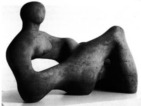
Рис. 1. Генри Мур. Полулежащая фигура. 1938

Скульптура изображает, главным образом, человека, ее главные жанры — портрет, исторические, бытовые, символические, аллегорические изображения, анималистический жанр. Наряду с изобразительными выразительными средствами, современная скульптура может использовать абстрактные формы (рис. 1).