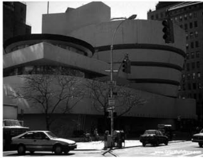
Рис. 1. Музей Гуггенхайма. Арх.: Ф. Л. Райт. Нью-Йорк, 1956 г.