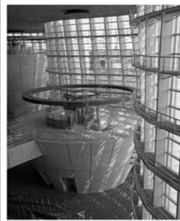
Рис. 2. Нац. центр иск. Арх.: К. Курокава. Токио. 2007 г. Интерьер