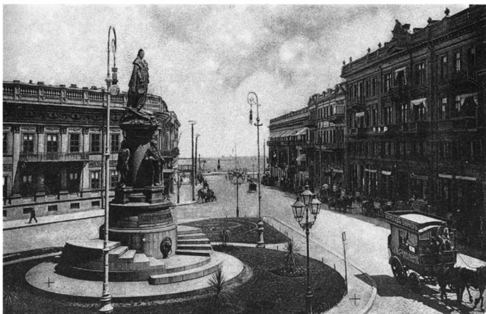
Рис. 4. Памятник Екатерине II и вид на Николаевский бульвар, 1912 г.