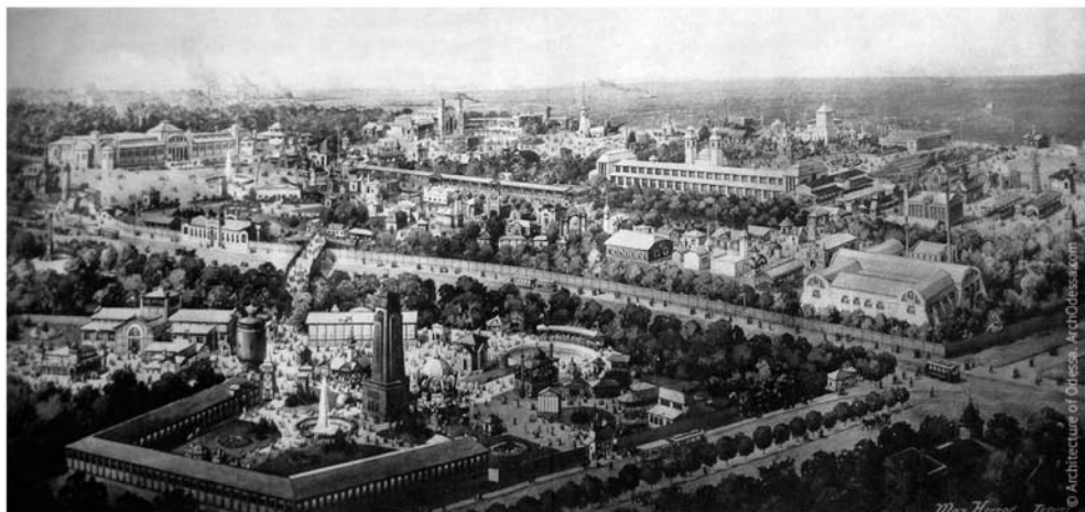
Рис. 3. Общий вид выставки в Одессе, 1910 г.