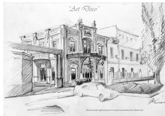
Рис.1. Пример упражнения по поиску стилового (дизайнерского) решения здания.

Проектирование архитектурных объектов предполагает умение уловить и повторить признаки и приемы, характерные для стильных проектов. Такое умение полезно и нужно, если делать это с умом, четко ставить себе задачи и решать их. И конечно, прикоснуться к произведениям мастеров - это всегда