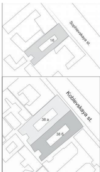
Рис. 1. Доходные дома Руссова, арх. Л. М. Чернигов, нач. XX в. Пятно застройки

периоду модерна (Рис. 6). Неожиданное решение автора – внести в характер оформления здания позднего модерна египетскую тему, в которой, как известно, оформлялись здания раннего декоративного модерна. Но в данной постройке египетская тема нашла новое звучание. Так аттик фланкируется с двух сторон скульптурами сфинксов, а барельефы в виде женских маскаронов декорированы стилизованным египетским орнаментом. Определяющим элементом декора этого здания, которое доказывает его "рациональность", является скульптурное панно, расположенное на эркерах, где изображены стилизованные под египетские обнаженные фигуры воинов, которые сплелись в порыве борьбы.