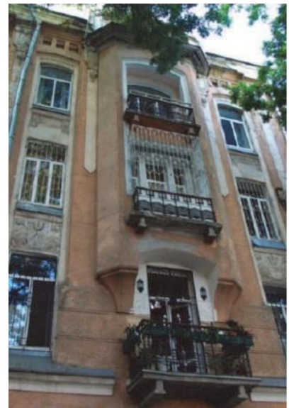
Рис. 5. Доходный дом Руссова по ул. Коблевской, 38-а