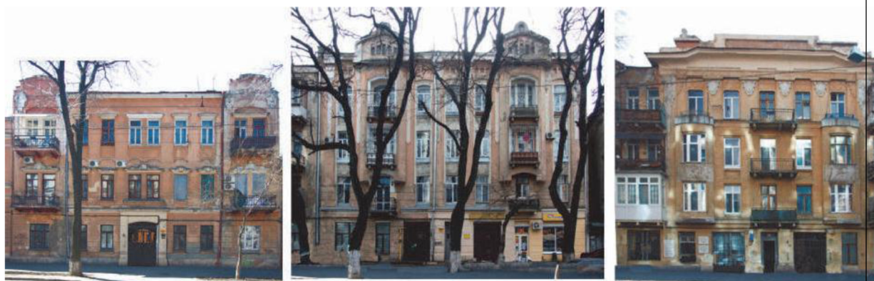
Рис. 3. Доходные дома Руссова, арх. Л. М. Чернигов, нач. XX в. фасады