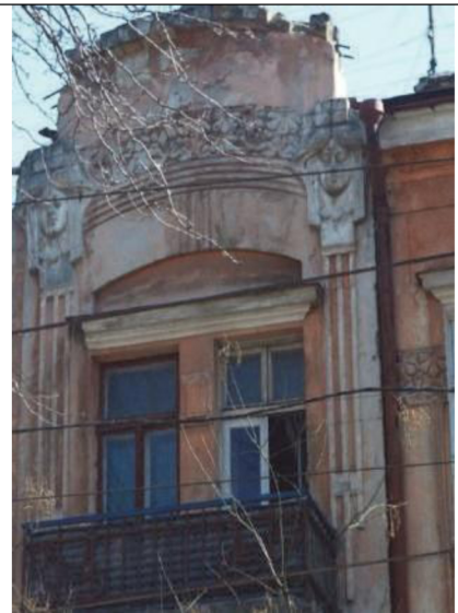
Рис. 4. Доходный дом Руссова по ул. Софиевской, 16