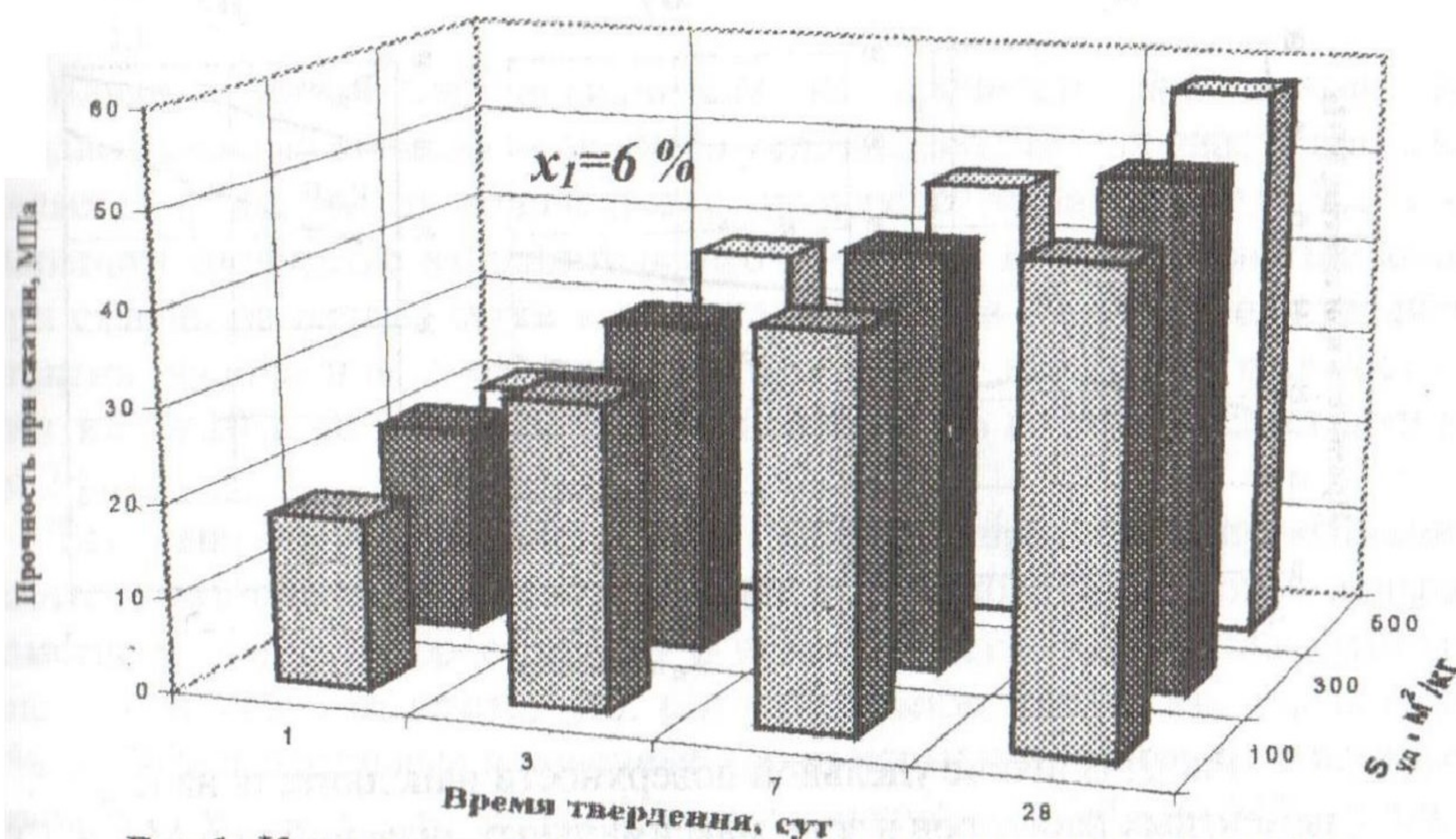
Рис. 1. Кинетика прочности при сжатии цементных растворов

практически одинаковой плотностью. В качестве конечных анализируемых параметров была принята прочность при сжатии и на растяжение при изгибе образцов-балочек 4 \times 4 \times 16 \text{ см} через 1, 3, 7, 28 сутки твердения в пластиковых пакетах.