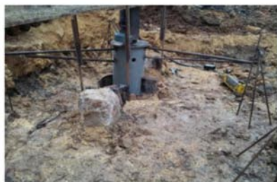
Рис.2. Верх колонны трубы