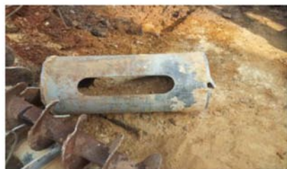
Рис. 1. Желонка для зачистки забоя скважины

см. После установки штампа монтировали загрузочную балку для передачи на него нагрузки. Балка при помощи анкеров крепилась к арматуре рабочих свай, расположенных вблизи скважины. Конструкция загрузочного устройства приведена на рис. 3.