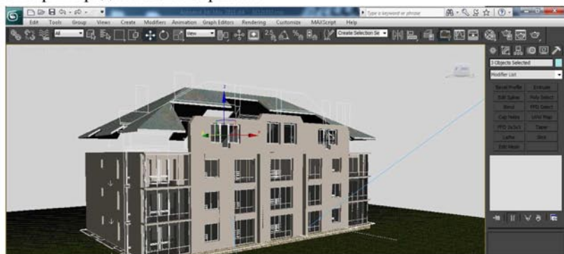
Рис.3 Построение объекта.

Модифицируем объект, придаем ему нужную высоту. Полученная геометрия представлена на рис. 3.