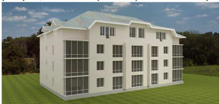
Рис.4 Применение платина V-Ray.

Для получения реалистичных изображений в программе 3D Max используют встраиваемые плагины, один из часто используемых V-Ray (рис. 4) разработанный компанией Chaos Group (Болгария). Поддерживает расчет на нескольких компьютерах. Хорошо себя зарекомендовал, имеет возможность настроек для получения фотореалистичных изображений, используется во многих сферах визуализации благодаря широкому набору инструментов для включения в рабочее проектирование для архитектурно-строительных компаний. Мощный инструмент визуализации, поддерживающий глубину резкости, эффект «размытия» в движении, карта смещения с увеличением детализации трехмерных объектов. Кроме этого имеет собственные источники освещения, систему солнце-небосвод для реалистичного освещения естественным светом, и физическую камеру с параметрами, аналогичными реальным фото — и видеокамерам.