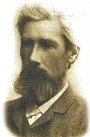
Рис. 4. Портрет Виктора Александровича Шретера

А улицу Пастера до сих пор украшает здание Реформаторской церкви (Рис.6). Возведение сооружения продолжилось вновь 30 апреля