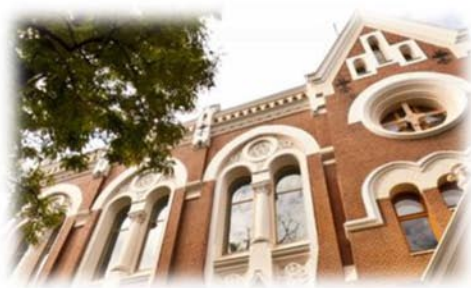
Рис. 6. Фасад Реформаторской церкви по улице Пастера, 62

Реформаторская церковь уникальна. Её оригинальный неоготический стиль идеально вписывается в планировку центра города. Церковь является одним из составляющих неповторимого образа Одессы. Хотелось бы, чтоб такие здания были достоянием не только национальной культуры, но и культуры всего мира. Внимание к памятникам архитектуры города является основной задачей государственных и культурных деятелей, ученых и общественности в целом.