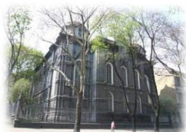
Рис. 1,2 Бродская синагога по улице Жуковского,18

Более детально, хотелось бы остановиться на Реформаторской церкви. Приверженцы этой конфессии проживали в Одессе с момента её основания, однако «возникновение Евангелическо-Реформаторской общины относится к 1842 году. Под руководством первых проповедников, община настолько возросла, что первоначальное наемное помещение для молитвенного дома оказалось недостаточным. «В виду же того, что Император Николай I подарил общине место на углу Херсон-