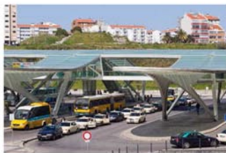
Рис.1 «Перрон (слева) и автобусная станция с пешеходным мостом(справа)»

Архитектурно-планировочная организация окружения в зоне влияния вокзальных комплексов должна отвечать требованиям гибкости развития застройки и благоустройства территории, компактности связей в планировании населенных пунктов. Для комфортной ориентации пассажира в пространстве транспортно-пересадочного узла необходимо использование больших открытых пространств, в том числе устройство атриумов и пассажей.