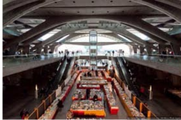
Рис.2 «Входная зона(слева) и распределяющий главный вестибюль с временной книжной выставкой(справа)»

Пространства необходимо разделять на зоны с использованием различных архитектурных приемов, зрительно ориентирующих пассажира в нужном направлении движения. Пример - вокзал Ориенте в Лиссабоне.