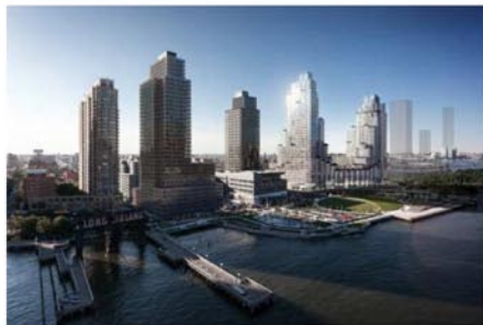
Рис.6. МФК «Hunters Point South»

Также недавно завершено строительство самого высокого здания Лондона – The Tower.