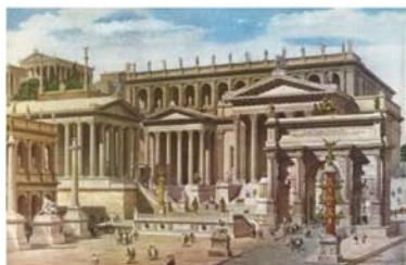
Рис.2 Римский форум

Многофункциональные объекты недвижимости проектировались уже в 20-30-е годы XX в., однако широкое их распространение началось в последней четверти прошлого и в начале нынешнего столетия.