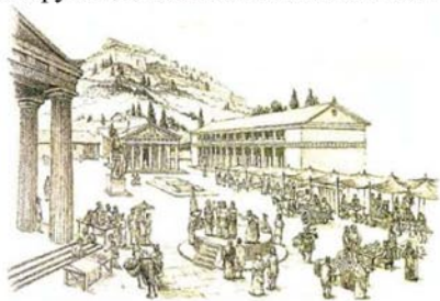
Рис.1 Греческая агора

Хотя, сказать, что МФК – это явление последних лет, было бы неправильно. По сути греческие агоры, римские форумы, средневековые монастыри были в определенной степени многофункциональными комплексами.