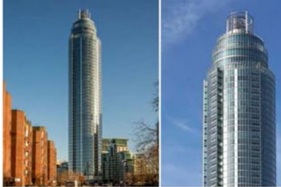
Рис.7 МФК «The Tower» в Лондоне