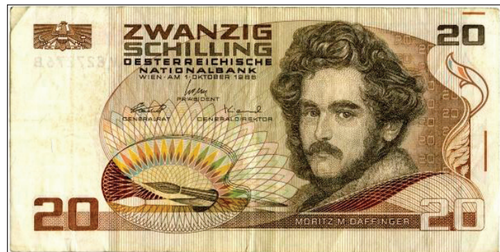
Банкнота 20 шиллингов Национального банка Австрии (1986 г.) с портретом знаменитого австрийского художника М. Даффингера

Художник умер в августе 1849 года в возрасте 59 лет от холеры, эпидемия которой была в это время в Вене. О его посмертной славе красноречиво свидетельствует тот факт, что вплоть до введения в обращение евро, австрийскую банкноту 20 шиллингов украшал портрет Морица Михаэля Даффингера. В каталоге картинной галереи Государственного музея изобразительных искусств имени А.С. Пушкина приведены сведения о трёх миниатюрных портретах работы Даффингера, хранившихся в коллекции музея. «Портрет графа А.К. Разумовского. Ок. 1820 <...> Бум., гуашь, акв. 12×9,5 (овал). Инв. 2298. Подпись справа: Daffinger . [Поступил] Из ГМФ в Москве в 1928; Портрет графини Марии де Ла Рош. 1830-е. Кость, гуашь. 12,5×9,7. Инв. 2791. Подпись слева карандашом: Daffinger .