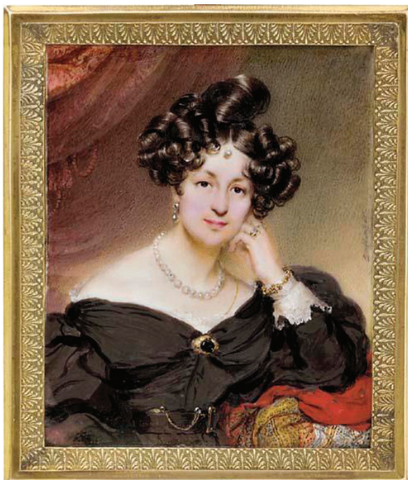
Мориц Михаэль Даффингер. Портрет графини Е.К. Воронцовой. Слоновая кость, акварель, гуашь