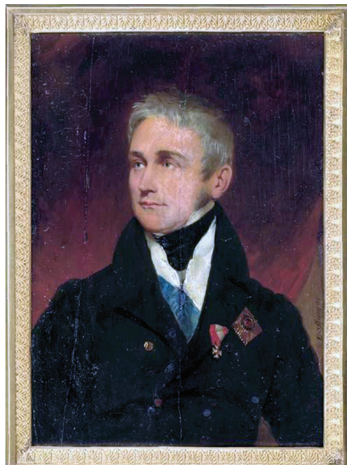
Мориц Михаэль Даффингер. Портрет графа М.С. Воронцова. Слоновая кость, акварель, гуашь