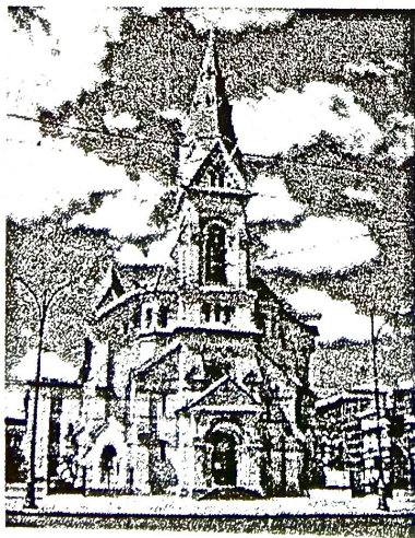
Рис. 4. Вид здания кирхи после восстановления

Совместными усилиями проектировщиков, строителей и лютеранской общины, Одессе была возвращена одна из её архитектурных достопримечательностей, ставшая по – настоящему одним из духовных и культурных центров города (рис. 4).