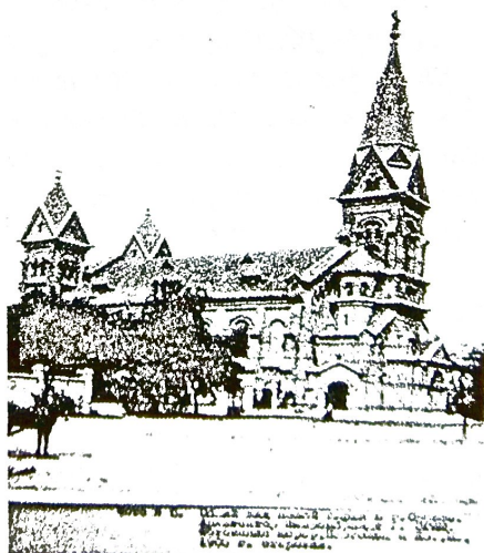
Рис. 2 Здание кирхи по проекту Г.Шеврембрандта

Фундаменты – из плит известняка. Несущие стены, выложенные из блоков пористого известняка и красного кирпича, арочные проёмы и аркатуры, многочисленные ниши, высокая крыша, покрытая марсельсь-