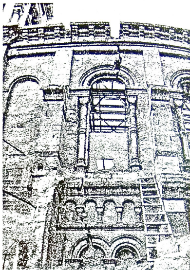
Рис. 3. Фотографии, иллюстрирующие техническое состояние здания

Совместными усилиями проектировщиков, строителей и лютеранской общины, Одессе была возвращена одна из её архитектурных достопримечательностей, ставшая по – настоящему одним из духовных и культурных центров города (рис. 4).