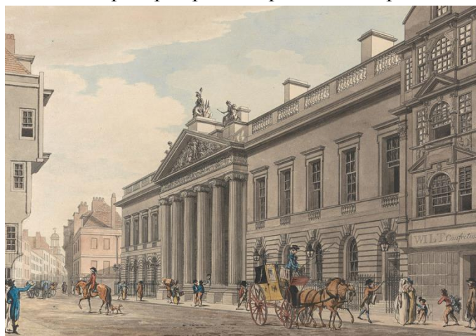
Мал. 1. East India House 1729р., Великобританія

До Нового часу повноцінних офісів не існувало - їх роль виконували всілякі місця від торгових лавок до храмів і палаців. Представники купецького стану розширювали свої бібліотеки і кабінети за рахунок додаткових прибудов. Головним завданням було здивувати ділового партнера красою і розкішшю приміщення.