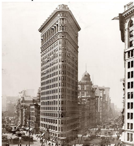
Мал. 3. Flatiron Building, 1904р.