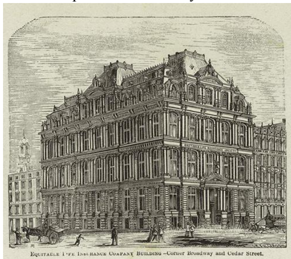
Мал.2. Equitable Building, 1870р.

Почався період будівництва багатоповерхових будівель перших хмарочосів. У Нью-Йорку в 1899 році була побудована тридцятиповерхова будівля, в 1908 році сорока семи поверхова будівля, а в 1913 році - шести десяти поверхова будівля. Це призвело до зростання цін на землю. У центрі Чикаго в 1880 році один акр коштував сто тридцять тисяч доларів, але вже в 1890 році він же коштував вже дев'ятсот тисяч доларів.