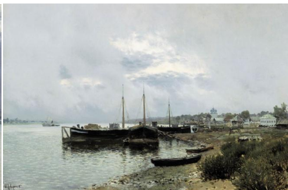
Рис. 2. И.Левитан «После дождя. Плес», 1889 г., х.м. 80x125 см, Государственная Третьяковская галерея, Москва

Современные художники-пейзажисты, в отличие от старых мастеров, стали прибегать к фрагментарной компоновке мотивов – сюжетов картин, условно говоря, хвататься за один незначительный, но красивый кусок пейзажа и всю, чаще всего скучную, композицию выстраивать вокруг него. Для максимальной выразительности работы появилась необходимость задуматься, как именно, какими живописными приемами нужно решать такой мотив, ставя на второй план вопрос «что именно?». Решать саму композицию, сюжет и идею задуманного. К примеру, многие современные импрессионисты, стремясь оказать впечатление от увиденного пейзажа, этюды пишут