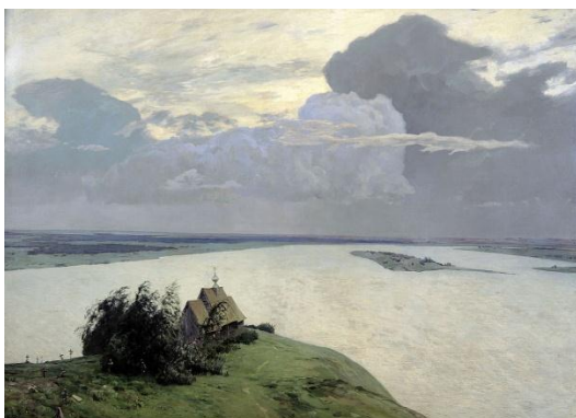
Рис. 1. И.Левитан. «Над вечным покоем», 1894 г., х.м. 150x206 см, Государственная Третьяковская галерея, Москва

Образованный художник может сказать, что «знает как», и стремится сделать и сотворить это «нечто», приблизиться к совершенству.