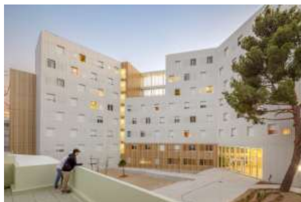
Рис.2 Гуртожитки Резіданс Люсьєн Коміль. Марсель. Франція