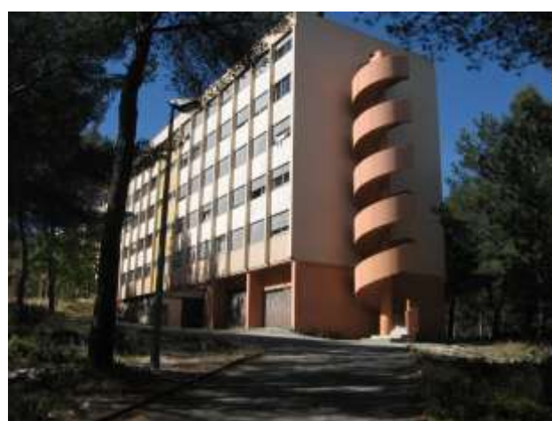
Рис.1 Гуртожитки кампусу ЛЮМІНА. Марсель. Франція