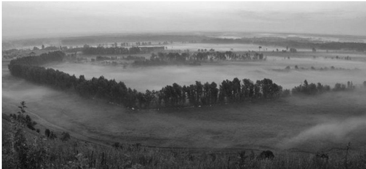
Рис. 1. Голосіївський ліс

доріг і стежок. Прикладом таких складних історичних ландшафтних комплексів можна назвати кілька парків Правобережної України. Найбільший лісовий масив Києва – Голосіївський ліс. Його територія розчленована глибокими балками, що виходять до долини Дніпра, і покрита щільними широколистяними насадженнями. Особливу мальовничість цьому лісопарку надають струмки, система ставків в східній частині і дерева-велетні, серед яких виділяються 500-літні дуби, 300-річні ясени (рис. 1.).