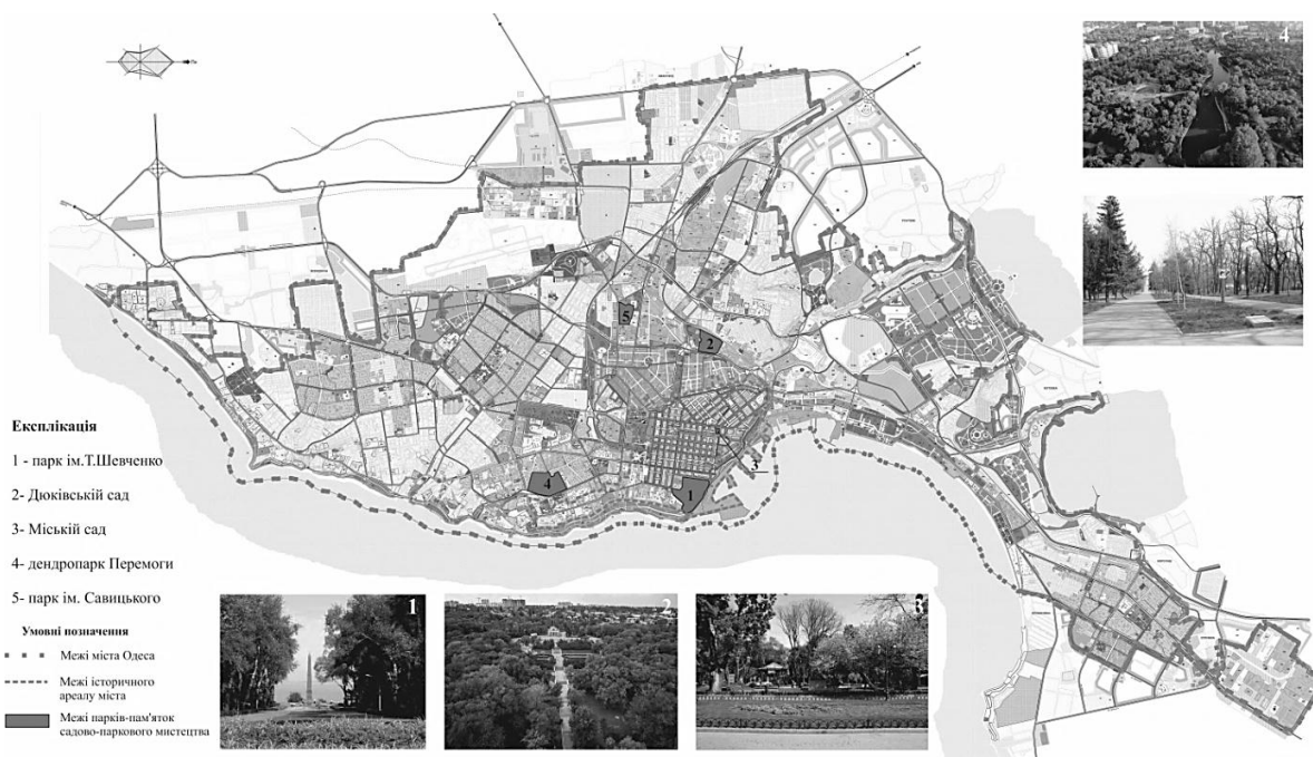
Рис. 4. Схема розташування парків-пам'яток садово-паркового мистецтва в м. Одеса

Нерідко історичні сади і парки набувають статусу пам'яток. Пам'ятки садово-паркового мистецтва – це історико-культурні пам'ятки, що органічно включають у свій склад рослини, особливості ландшафту (пагорби, джерела води та водоспади, долини ручаїв чи річок, каміння, скелі, дальні пейзажні перспективи, іноді заболочені ділянки), архітектурні споруди, скульптури, квітники тощо [12]. Всього в Україні налічується 88 історичних парків-пам'яток садово-паркового мистецтва загальнодержавного і 426 місцевого значення [13]. Парки-пам'ятки садово-паркового мистецтва місцевого значення включають: парки культури і відпочинку, дендропарки, ділянки лісу, які використовуються як парки відпочинку, тобто є лісопарками, та інші об'єкти. Зокрема в Одеській області розташовано 22 парка-пам'ятника, в м. Одеса – 5 парків-пам'яток садово-паркового мистецтва (парк ім. Т. Шевченка, Дюківський сад, Міський сад, дендропарк Перемоги, парк ім. Савицького) (рис. 4).