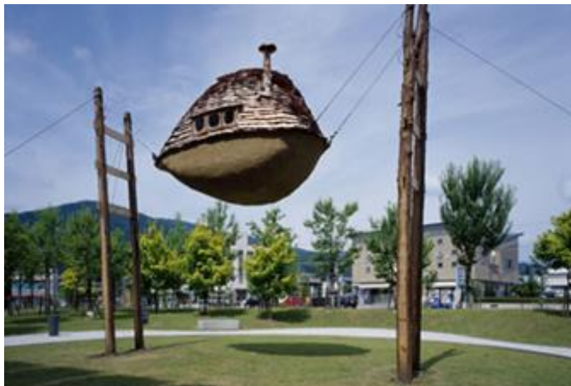
Рис 11. Летающая земляная лодка