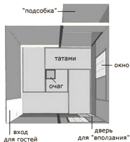
Рис 3. План чайного дома

«Нака-басира» отнюдь не определяет геометрического центра комнаты и практически не имеет функций опоры. Ее роль по преимуществу символическая и эстетическая. Чаще всего она исполнена из естественного, иногда даже чуть искривленного и покрытого корой ствола дерева. В интерьере чайной комнаты с четкой линейностью всех очертаний «нака-басира» воспринималась как свободный пластический объем, подобно скульптуре, организующий вокруг себя пространство, вызывая необходимые в эстетике чайной церемонии ассоциации с безыскусной простотой природы, лишенной симметрии и геометрической правильности форм, подчеркивая идею единства дома и природы, отсутствие противостояния созданного человеком сооружения и нерукотворного мира. Мастера чая считают, что «нака-басира» является олицетворением идеи «несовершенного» как выражения подлинной красоты [4].