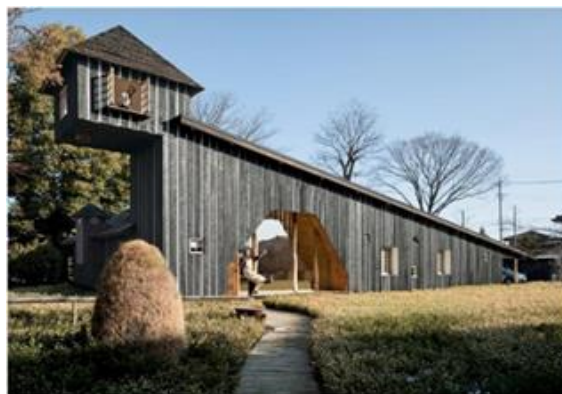
Рис 6. Угольный дом

«Угольный дом» (рис. 6) построил в Нагано архитектор Терунобу Фудзимори. В доме оборудованы гостиная, обеденная зона, две спальни, комната для учебы и чайная комната, которую разместили в башне. Кедровые доски для фасада длиной 8 метров специально закоптили. Из-за такой длины досок материал деформировался в процессе установки, поэтому щели между ними были заложены гипсом и штукатуркой. Для угольного дома за идею была взята концепция пещеры [6].