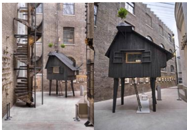
Рис 10. Домик Жука

Ему же принадлежит целый ряд оригинальных чайных домиков: чайная беседка под названием «Летающая земляная лодка» (рис. 11), которая располагается напротив музея искусств Нагано, подвешена на металлических тросах и деревянных опорах [9]. Чайный домик «Троянская свинья» (рис. 12) расположен в Германии [10].