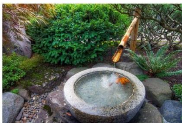
Чаша для омовения