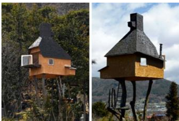
Рис 7. Такасуги-ан

наслаждению чаем и созерцанию природы», – говорит Фудзимори. При строительстве этого необычного дома использовались легкие, доступные и самые простые материалы – гипс и бамбук. А из трех окон домика открывается прекрасный вид на кроны соседних деревьев и живописную долину [6]. Фудзимори имеет склонность проектировать и создавать структуры, которые выглядят нестабильно и асимметрично, с необычным расположением, и находящиеся в противоречии с законами физики. Так, его гостевой домик (рис. 8) как будто висит в воздухе и поддерживается только одной из стен [6].