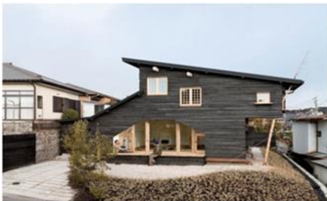
Рис 5. Черный дом

Терунобу Фудзимори разрабатывает проекты, которые являются одновременно экспериментом и ремеслом и берут свое начало из японских традиций. Один из оригинальных проектов Фудзимори – это «Чёрный дом» (рис. 5). Поверхность этого дома покрыта обугленными досками. «Чайная комната» в доме как-бы «висит» на уровне второго этажа, войти в неё можно только через потайной вход.