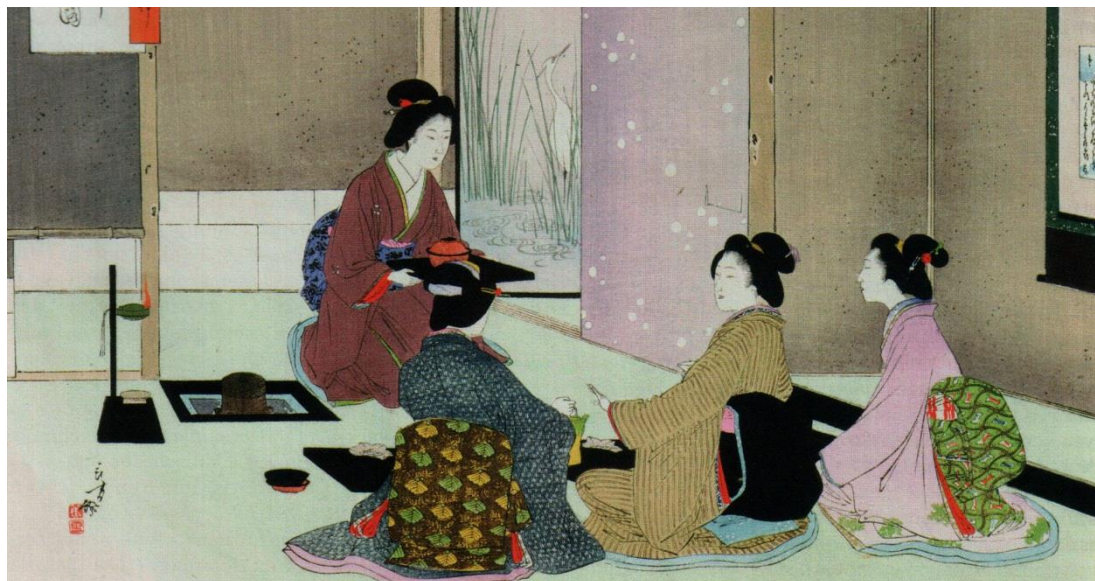
Рис 4. Чайная церемония. Художник Мизуно Тошиката, XIX век

Терунобу Фудзимори разрабатывает проекты, которые являются одновременно экспериментом и ремеслом и берут свое начало из японских традиций. Один из оригинальных проектов Фудзимори – это «Чёрный дом» (рис. 5). Поверхность этого дома покрыта обугленными досками. «Чайная комната» в доме как-бы «висит» на уровне второго этажа, войти в неё можно только через потайной вход.