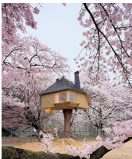
Рис 9. Парящий домик

Музей изобразительного искусства в японском городе Хокуто пригласил архитектора Торунобу Фудзимори создать чайный домик, парящий среди ветвей цветущей сакуры (рис. 9). Ствол кипариса, который держит на себе всю конструкцию, проходит через внутреннюю часть дома, создавая уникальную фокусную точку. Несмотря на внешнюю хрупкость, чайный домик разработан так, что способен выдержать сильный ветер [7]. Ему принадлежит и другое решение — «Домик Жука» (рис. 10) предназначен для проведения традиционной чайной церемонии. Домик разместились во дворе лондонского музея V&A, где любопытные могут его внимательно изучить: один небольшой этаж, ножки, крыша и лесенка. В домик можно попасть через люк, расположенный в полу [8].