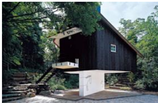
Рис 8. Гостевой домик

Музей изобразительного искусства в японском городе Хокуто пригласил архитектора Торунобу Фудзимори создать чайный домик, парящий среди ветвей цветущей сакуры (рис. 9). Ствол кипариса, который держит на себе всю конструкцию, проходит через внутреннюю часть дома, создавая уникальную фокусную точку. Несмотря на внешнюю хрупкость, чайный домик разработан так, что способен выдержать сильный ветер [7]. Ему принадлежит и другое решение — «Домик Жука» (рис. 10) предназначен для проведения традиционной чайной церемонии. Домик разместились во дворе лондонского музея V&A, где любопытные могут его внимательно изучить: один небольшой этаж, ножки, крыша и лесенка. В домик можно попасть через люк, расположенный в полу [8].