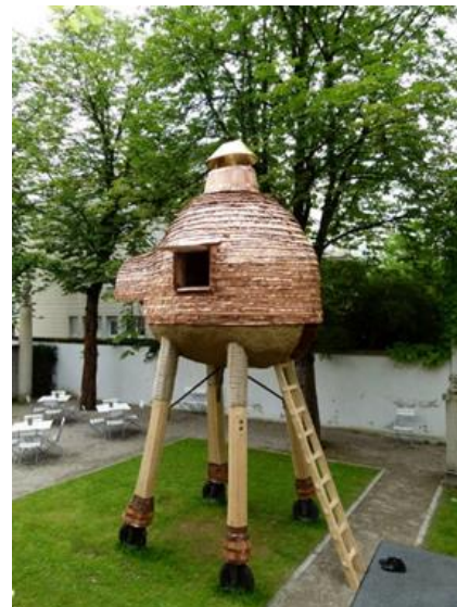
Рис 12. Троянская свинья

Выводы: В наши дни искусством чайной церемонии в основном занимаются женщины (рис. 5). Сейчас чайная церемония нередко проводится не только в чайных павильонах, но и в одной из жилых комнат дома; часто чайной церемонии предшествует угощение. Однако неизменным остается дух чайной церемонии: стремление создать обстановку душевности, отойти от суетных, повседневных забот и дел. По-прежнему чайная церемония – это время для бесед о прекрасном, об искусстве, литературе, живописи, о чайной чашке и свитке в «токонома». То есть при всех изменениях в архитектуре чайных домиков остается их философия: в суете жизни нельзя забывать о прекрасном – о гармонии мира.