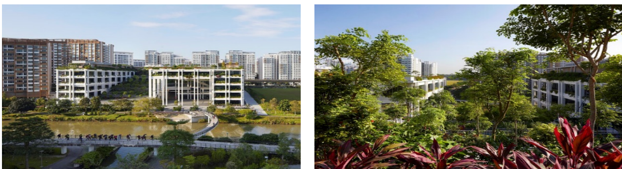
Рис. 4. «the Urban Heat Island – UHI», Сингапур.

В больших массивах с многоярусными насаждениями высокой плотности, используются вышеперечисленные способности зеленых насаждений, примером может служить Поликлиника с вертикальным садом в Сингапуре. (Рис.4)