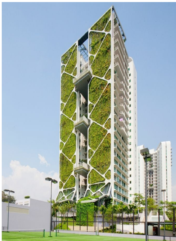
Рис. 1. Высотное здание «Tree house», Сингапур.

Город-государство Сингапур накрыл густой смог, который ветер несет со стороны индонезийского острова Суматры, окутанного многочисленными лесными пожарами. Смог для Сингапура - явление не новое, периодически дымка окутывает город. Самый страшный случай произошел в 1997 году, когда пелена дыма и смога, разносимых ветром, буквально накрыла большие территории Юго-Восточной Азии. Снижению уровня загрязнения воздуха способствует организация различных типов зеленых насаждений, примером может служить высотное здание «Tree house» (Рис.1), в котором устроена вертикальное озеленение, в виде сада площадью 2,289 м2. арх. бюро City Developments Limited (CDL) и местным архитектор из ADDP Architects.