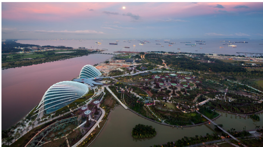
Рис. 2. Природный парк «Сады у залива», Сингапур.

Одна из серьезных проблем Сингапура заключалась в том, что в стране почти не было собственной пресной воды - ее до сих пор частично приходится покупать в Малайзии. Кроме того, две основных реки в городе - Сингапур и Каланг на момент обретения независимости государства находились в ужасном состоянии. По сути они были канализационными коллекторами, куда ремесленники сливали остатки нефти и масла, а фермеры - различные отходы. Для сохранения водного бассейна города Ли Куан Ю, внедрил проект по строительству запруд на всех ручьях и реках. Только дождевые стоки, чистые собранные с крыш, садов, парков, скверов и различных зеленых площадей могли попадать в эти водоемы. Современное строительство природного парка «Сады у залива» (Singapore's Gardens by the Bay) а также инновационный зимний сад «Wilkinson Eyre Architects» (Рис.2), который способствует очистки стоковых вод, путем фильтрации через насаждения вокруг набережной.