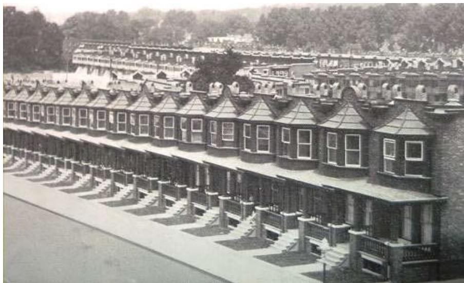
Мал. 4. Блокована забудова 1914 р. (Балтимор, Англія)

«rowhouse» отримав нове народження - американський «townhouse» - власний будинок представників середнього класу.