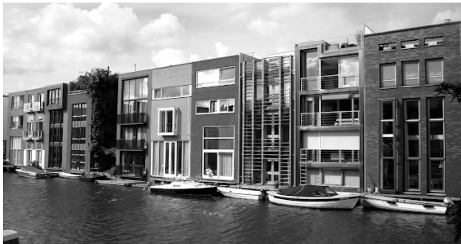
Мал. 1. Таунхауси в районі Борнео-Споренбург

Основний матеріал і результати. Існують чотири основні варіанти житлової забудови міст [2]: високоякісного багатоповерхового будівництва (модель Гонконгу), багатоповерхових будівель низької щільності забудови (модель Ле Корбюзьє), малоповерхового будівництва низької щільності (модель Далласа) і малоповерхових будинків високої щільності (модель «старої» Європи). На думку провідних розробників житлових програм, найбільшою привабливістю володіє модель «компактних міст» - комплексів малоповерхових (до 2-4 поверха) будинків високощільної забудови (мал. 1).