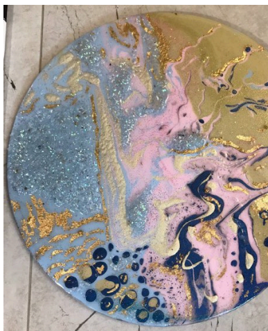
Флюид Свидерская А.С.- 2019 г.