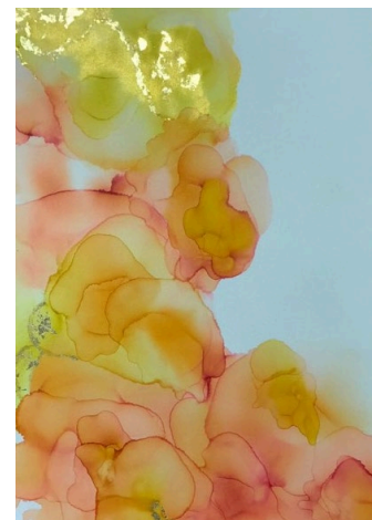
Алкогольная живопись Свидерская А.С.-2020 г.