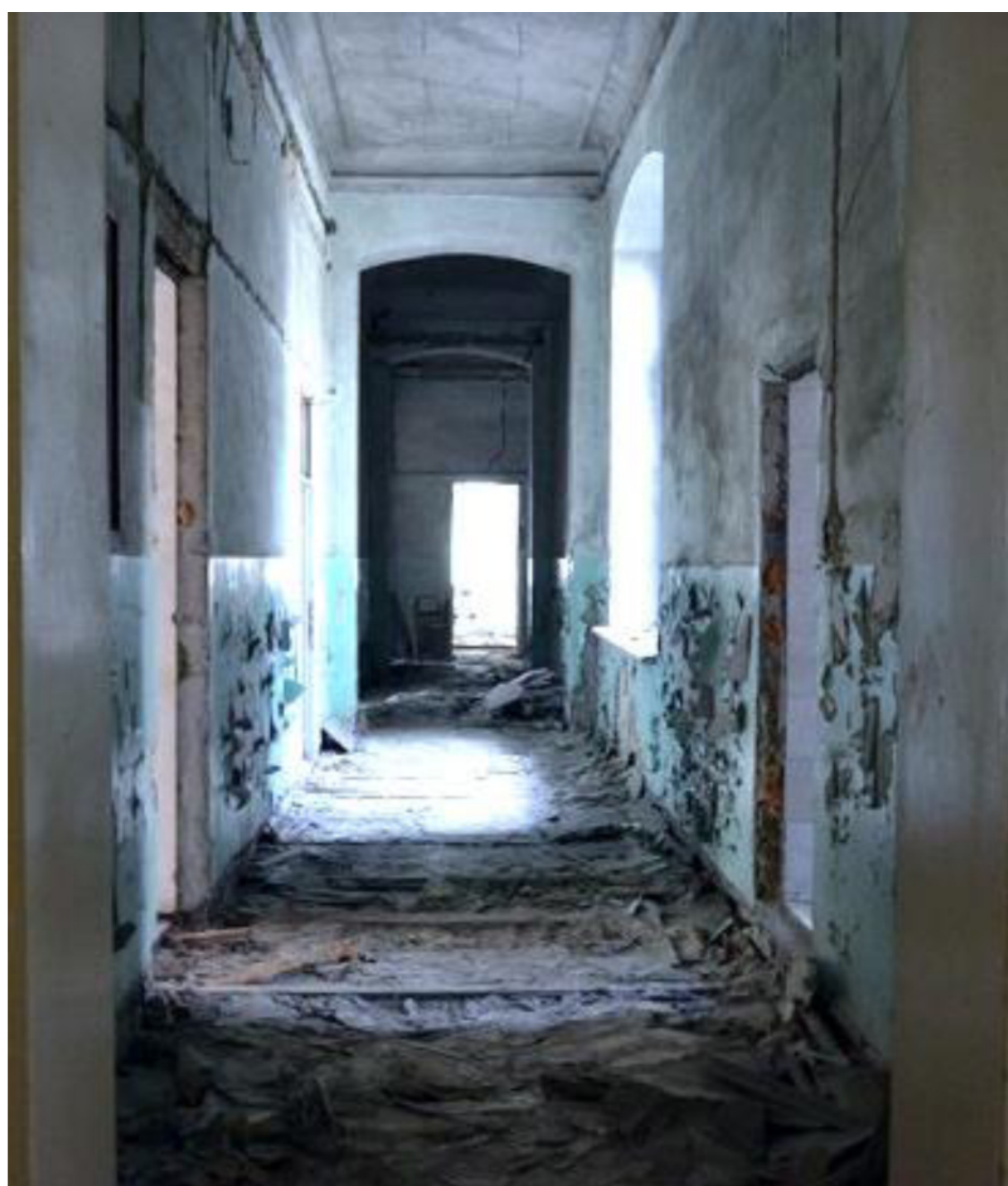
Рис. 2 Современное состояние интерьеров бывшего училища

Выводы. Материальная ценность исторической формы уже сама по себе предполагает дальнейшее развитие, возможность активного включения в современную жизнь. Историко-архитектурный анализ показал, что объемно-планировочная структура комплекса Епархиального училища формировалась поэтапно. Его стены хранят информацию не только о строительных технологиях, но и историческую память, ее символическое и духовное значение. В поиске компромисса между образом и наслоением функций структуры бывшего училища предложена программа ее переоценки, реабилитации под центр детского творчества.