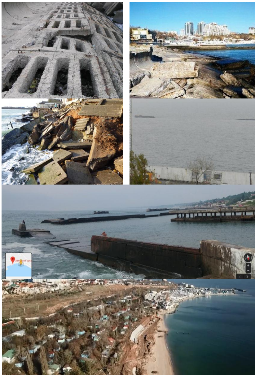
Рис. 1. Примеры повреждений берегозащитных гидротехнических сооружений и защищаемой территории г. Одессы и г. Черноморск