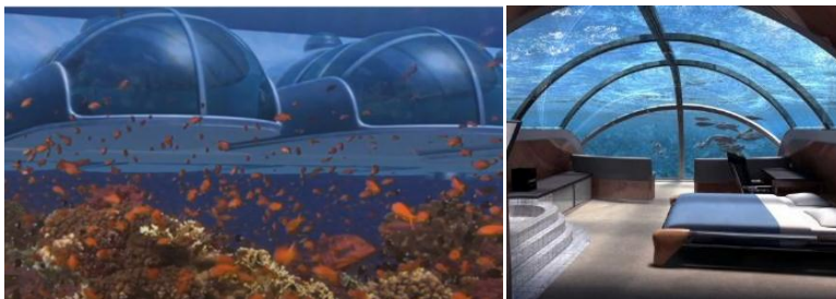
Рис. 4. Вид подводного номера отеля внутри и снаружи

На глубине 15 м создана настоящая подводная гостиница. Здесь к услугам гостей предоставлены 25 комнат-капсул, включая роскошный сьют «Наутилус» площадью 300 м 2 . Номера в виде съемных блоков крепятся к трубе-коридору (рис. 4). Большая часть стен – из прозрачного акрилового стекла (толщиной 100 мм). Безопасность всей системы обеспечивает система шлюзов.