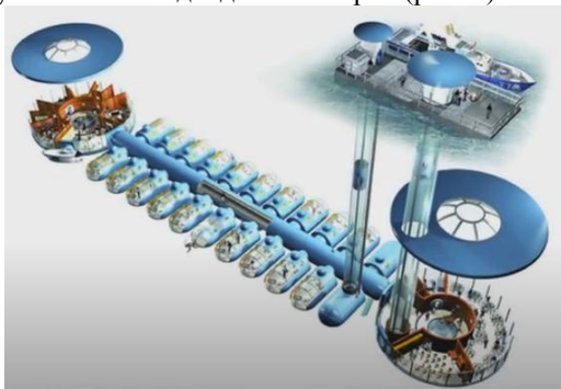
Рис. 3. Схема подводного отеля Poseidon Undersea Resort

из островов Фиджи. Poseidon Undersea Resort состоит из 73 номеров, 48 наземных бунгало и 25 подводных номеров (рис. 3).