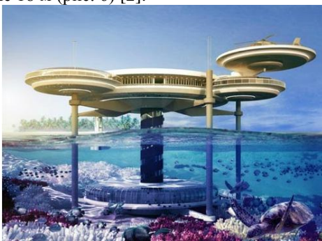
Рис. 6. Компьютерная модель внешнего вида отеля Hydropolis Undersea Resort в Дубае

Подводный отель Hydropolis Undersea Resort в Дубае будет расположен на самом берегу моря в Персидском заливе, с подводной частью на глубине 18 м (рис. 6) [2].