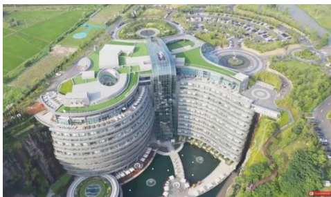
Рис. 5. Отельный комплекс Intercontinental Shimao Wonderland

Уникальную технологию отеля на морском дне, из окон которого открывается вид на коралловые заросли и разнообразный подводный мир разработали и внедряют в жизнь специалисты польской архитектурной студии Deep Ocean Technology (DOT). Подводные отели под названием Water Discus ("Водный диск") уже открылись на Мальдивах и во Флориде. Но наиболее масштабный проект будет воплощен в Дубае.