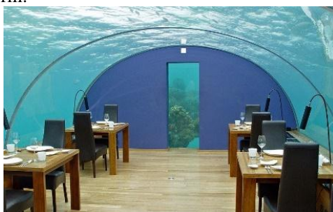
Рис. 2. Подводный ресторан «Итхаа»

Подводный ресторан «Ithaa Undersea Restaurant», расположенный на Мальдивах, является одним из первых подводных ресторанов в мире. Строительство «Итхаа» было полностью окончено в 2005 году. Время эксплуатации этого ресторана рассчитано на 20 лет. Его конструкции собрали в Новой Зеландии, а потом уже доставили на Мальдивы и установили на глубине 5м. Главной достопримечательностью ресторана является коробовый свод из акрилового стекла – зал ресторана (рис. 2). Помещение рассчитано на 14 посетителей, но рамки пространства зрительно раздвигаются благодаря единению с подводным миром. Внутрь попадают по проходу и винтовой лестнице с территории надводного ресторана Sunset Bar and Grill.