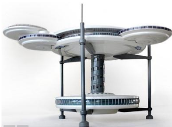
Рис. 7. Макет отеля Hydropolis Undersea Resort в Дубае

Надводная часть отеля будет состоять из основного и нескольких дополнительных дисков, соединенных между собой. На вершине отельного комплекса расположится площадка для приземления вертолетов, сады с необычными растениями, бассейны и парки. В нижнем ярусе разместятся подводный бар и 21 подводный номер. Из коридора отеля можно будет выйти сразу в океан, благодаря установке декомпрессионной камеры. Все материалы и конструкции подводной части отеля будут выполнены из сверхпрочного органического стекла, металла и железобетона на сваях.