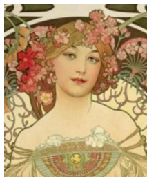
Рис. 5. Фрагмент картини А. Мухи

Художник повинен бути дуже спостережливим. Тільки так можна досягнути висот у мистецтві портрету. Має бути «надивленність» (зорова пам'ять). Ви ніколи не задумувались над тим, як виглядають в старості щасливі люди? Вони виглядають похмурими. Для того, щоб посміхнутися ми використовуємо цілу групу м'язів. Круговий м'яз рота, вилична м'яз, носогубний піднімач, щічний м'яз. За життя ці всі м'язи зношуються і, від постійно піднятих куточків рота, опускаються. Тому з першого погляду складається враження, що людина сумна і, можливо, навіть груба. Всі ці нюанси є дуже важливими у передачі психології людини на портреті і треба бути дуже проникливою людиною, щоб уміти це бачити.