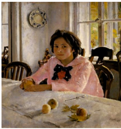
Рис. 2. «Дівчинка з персиками», Валентин Серов

Портрет був виконаний за чотири дні – 2-5 березня 1881 року в Петербурзі, в лікарняній палаті Миколаївського військового госпіталю. Рєпін писав портрет близької йому людини, вже знаючи, що Мусоргський хворий невиліковно і його смерть близька. Мусоргський помер 16 березня того ж року. У творчості Рєпіна це унікальний випадок, коли художник створив портрет людини, що знаходиться "перед обличчям вічності", наодинці з самим собою, не позує і не показує світові своє "станове амплуа". Заворожує ліпка