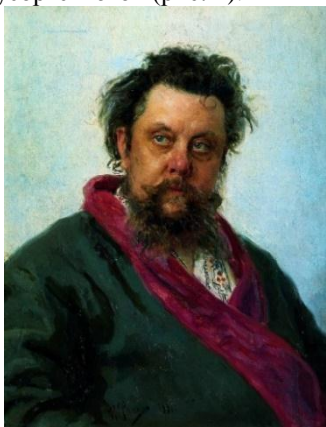
Рис. 1. «Портрет композитора М.П. Мусоргського», Ілля Рєпін

Один з найважливіших художників для світового живопису – Ілля Єфимович Рєпін, неперевершений майстер портрету. Глибокий психологізм пронизує кожен мазок його пензля. Безкінечно можна продовжувати говорити про полотна Іллі Єфимовича. Але є один портрет, який вразив мене найбільше. Це «Портрет композитора М.П. Мусоргського» (рис. 1).