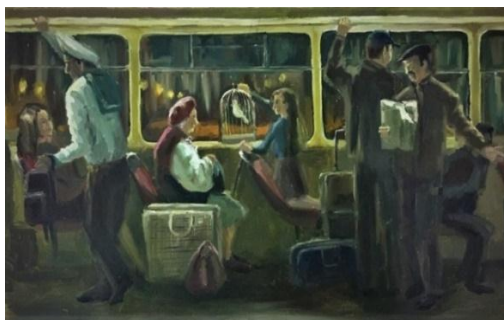
Рис. 3. Композиція «Fusion»

вони стають тими, хто вони є. Чи помічали ви, що ввечері все здається інакшим. Ми починаємо відчувати свою справжність і щирість.