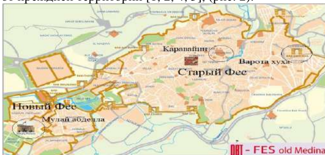
Рис. 2. План Феса: старого (859г.) и нового (1276г.).

отделенные районы, изначально объединявшие ремесленников конкретной профессии – ткачей, сапожников, гончаров, ковроделов, красильщиков и др. В настоящее время в медине в Фесе такая же система узких извилистых улиц и улочек, тесно застроенных жилами домами в 3–4 этажа. Современный Фес с 1916г. застраивается к юго-западу от прежней территории [1, 2, 4, 5], (рис. 2).