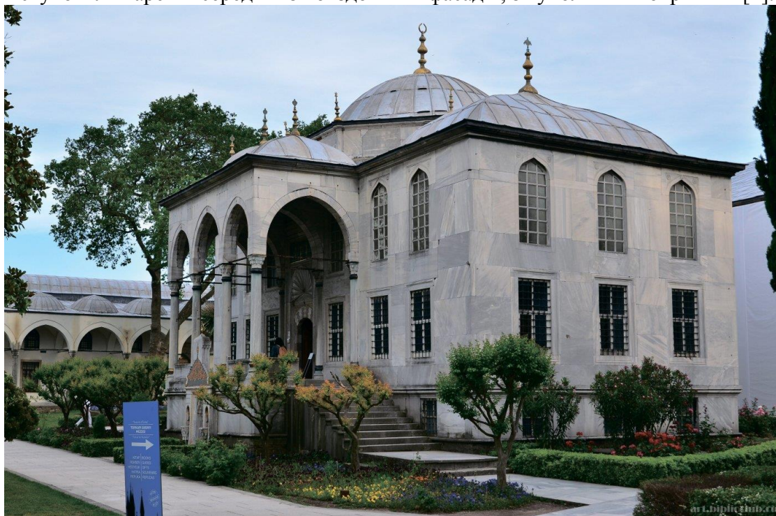
Рис. 1. Бібліотека Ахмеда III. Загальний зовнішній вигляд

Ще треба відмітити серед значних будівель бібліотеку Ахмеда III (рис. 1) (1719р.). Ця «значна будова» – невелика, прямокутного плану з триарковим портиком і симетричним йому виступом-ліхтарем в середині з повздовжнів фасадів, з купольним покриттям [1].