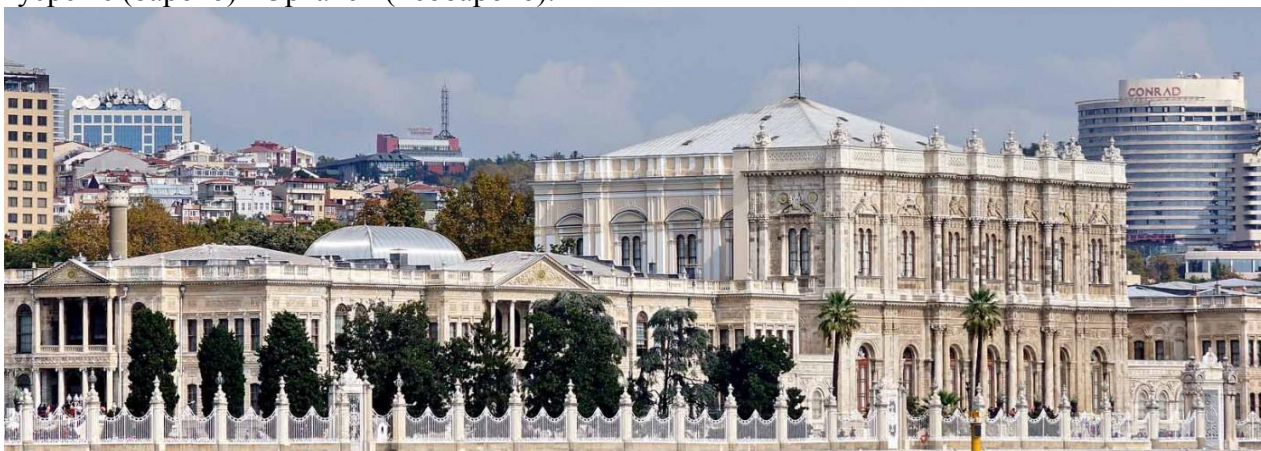
Рис. 2. Палац Долмабахче. Загальний зовнішній вигляд

З початку XVIII ст. став розростатися комплекс Топ-Капи, який був закінчений у 1804 р. зведенням павільйону Меджидіє. А з другої половини XIX ст. споруджено два палаці: Долмабахче, 1843-1856 рр. (рис. 2) і Бейлербей, 1865 р. Слід відмітити, що архітектура XIX ст. втрачає поступово риси національного характеру і йде в ногу з загально європейськими стилями. Цей вихід позначився у павільйоні Меджидіє (1840 р.), а потім мав розквіт у спорудах початку з другої половини XIX ст. Так, у 3-х поверховому палаці Долмабахче фасади вирішені у змішаному національному з європейськими (необароко) стилі (але інтер'єри – у чистому бароко). Такі ж характерні риси має і палац Бейлербей. Вихід від національної архітектури вирізняє всі визначні споруди Стамбулу у XIX ст., навіть мечеті Нусретіє (бароко) і Ортакей (необароко).